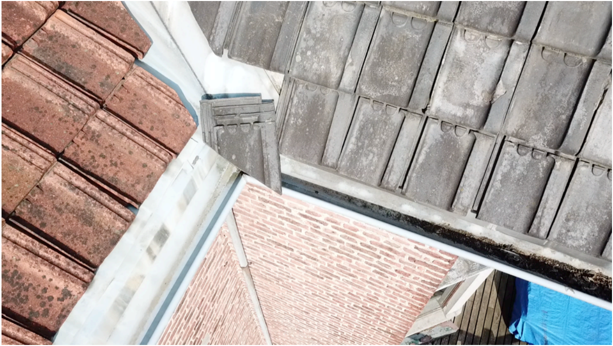
Fig. 25. Tuile sud 2.