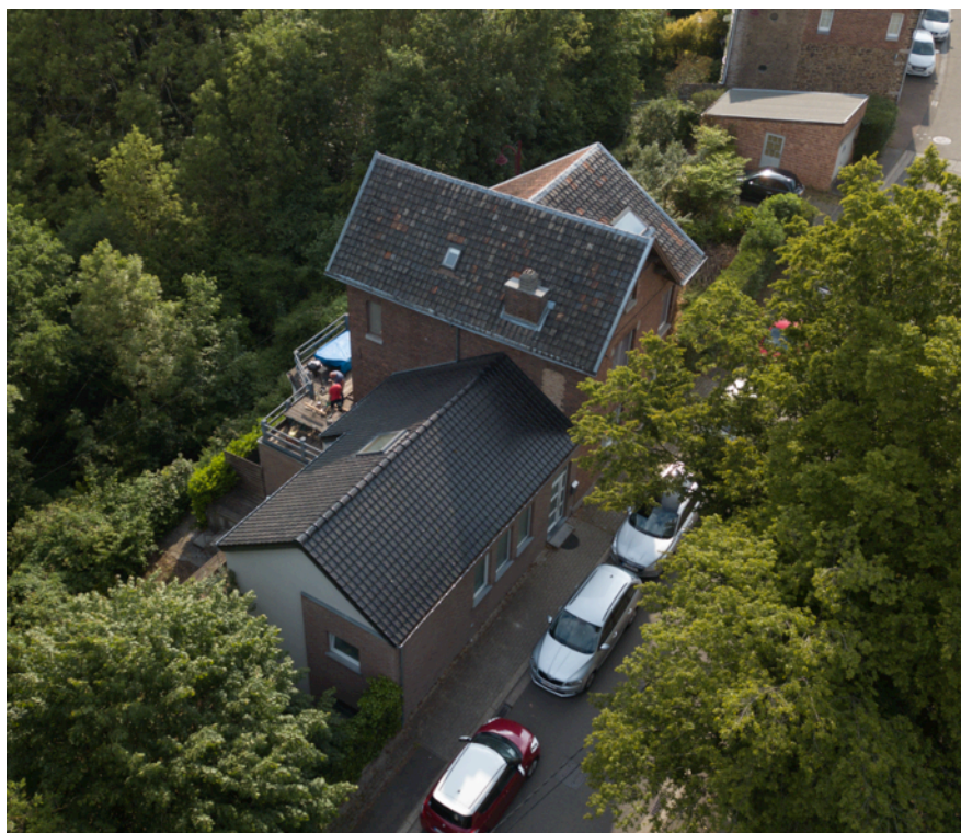
Fig. 2. Vue aérienne 2.