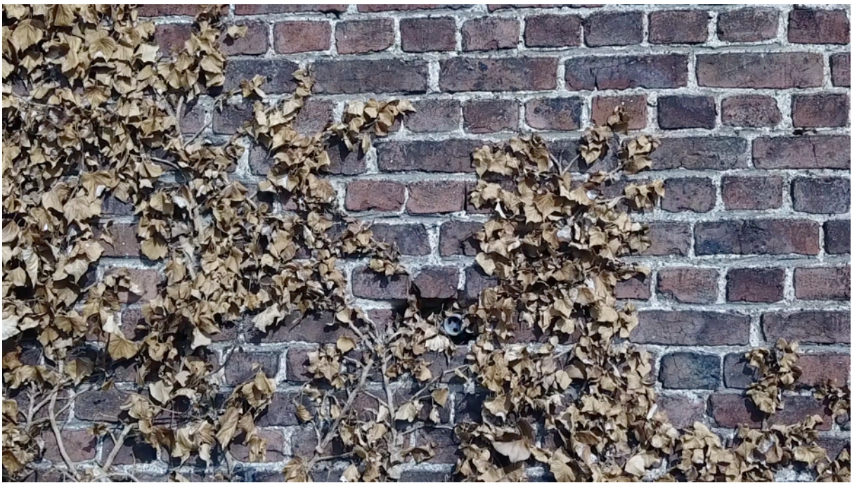
Fig. 32. Percement dans les lierres mur ouest.