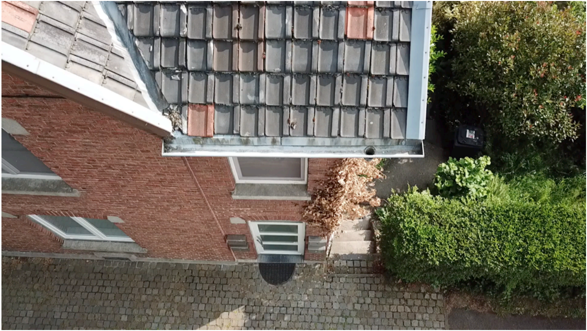
Fig. 21. Gouttière nord-ouest.