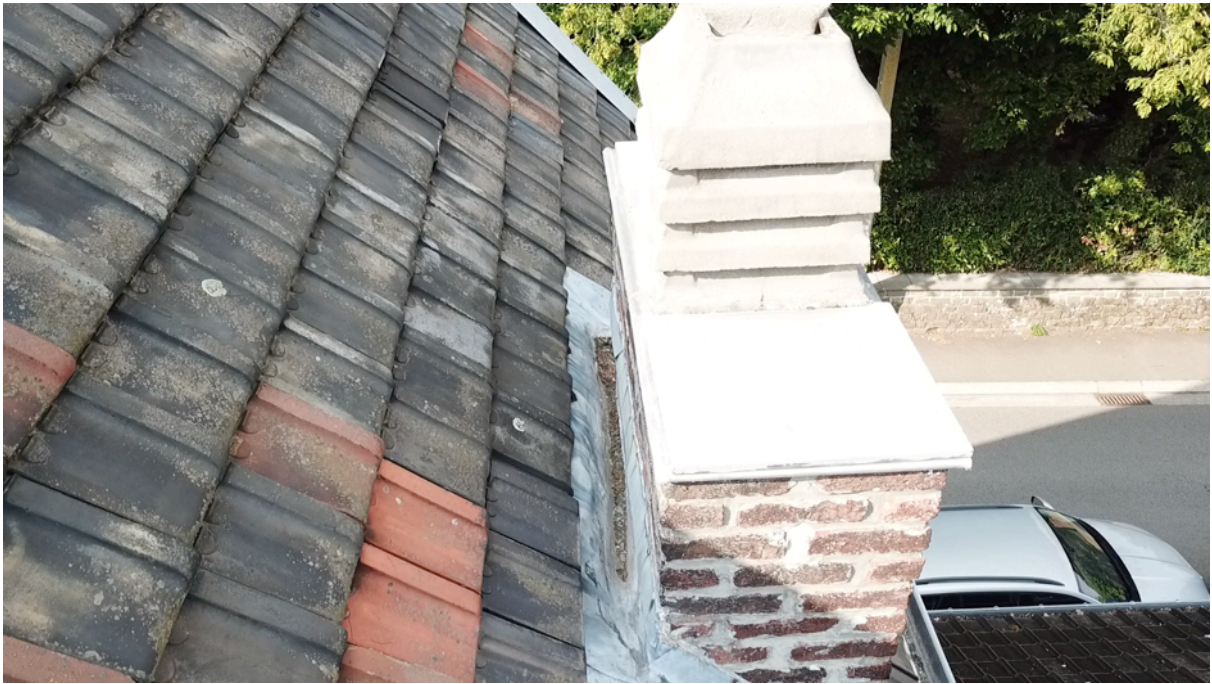
Fig. 18. Cheminée est 4.