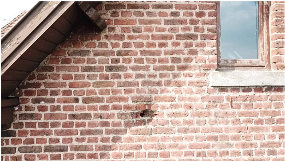
Fig. 28. Impact d'artillerie éloigné mur sud.