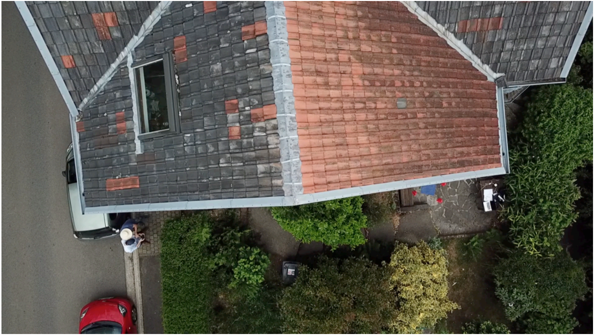
Fig. 5. Toiture ouest bâtiment haut.