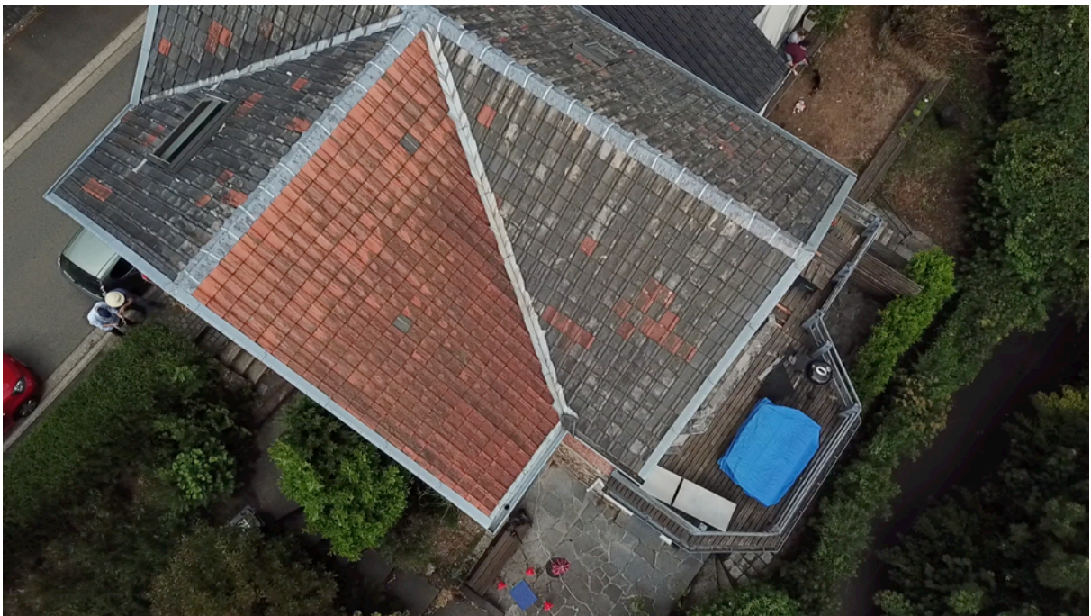
Fig. 4. Toiture sud-ouest bâtiment haut.