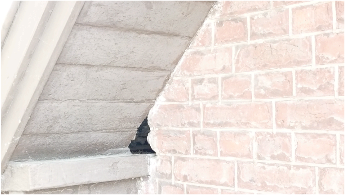
Fig. 23. Orifice façade nord 2.