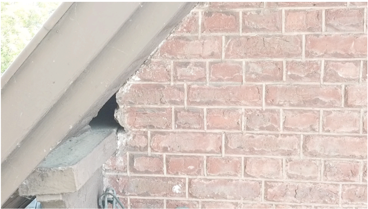
Fig. 24. Orifice façade nord 3.