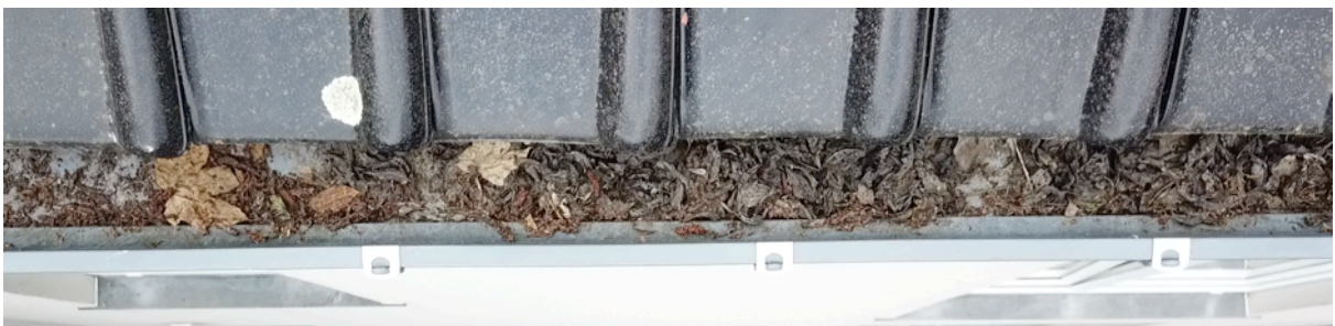
Fig. 9. Gouttière sud bâtiment bas 1.