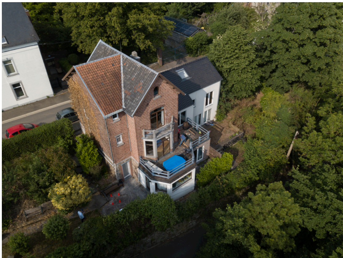
Fig. 1. Vue aérienne 1.