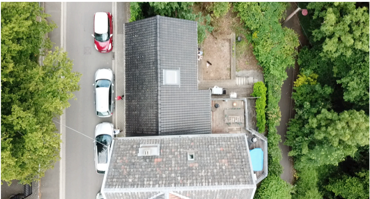
Fig. 8. Vue aérienne bâtiment bas.