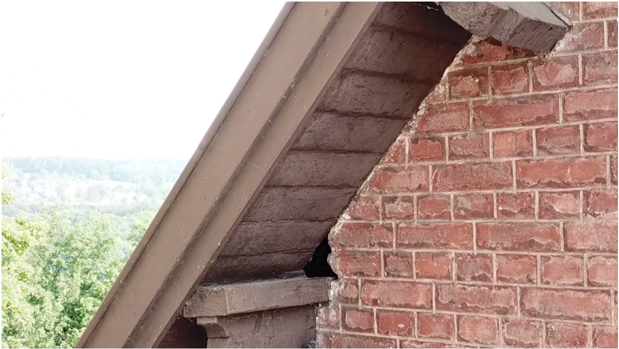
Fig. 22. Orifice façade nord 1.