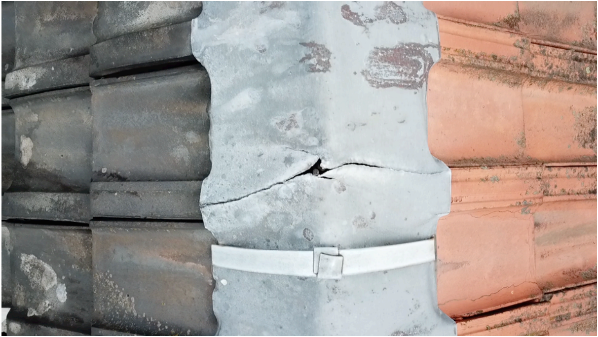
Fig. 7. Fissure dans le plomb du faite du bâtiment haut.