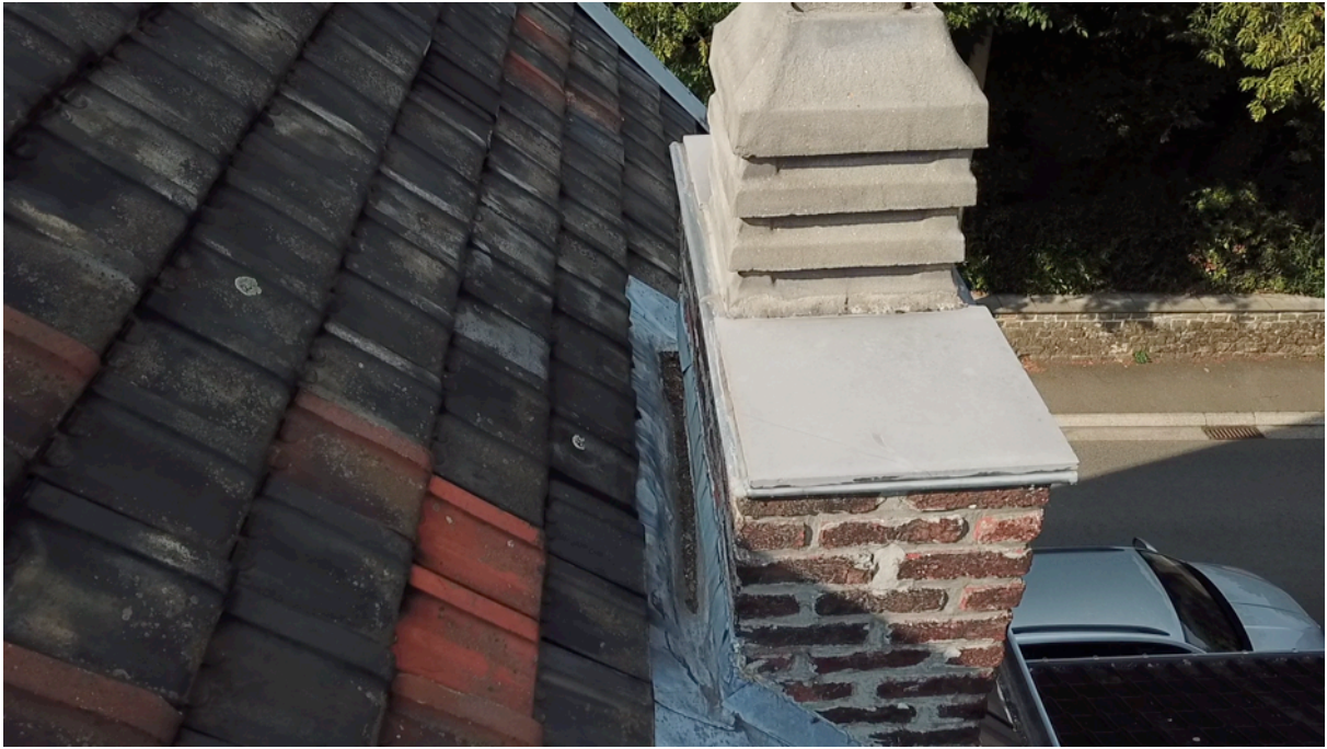
Fig. 17. Cheminée est 3.