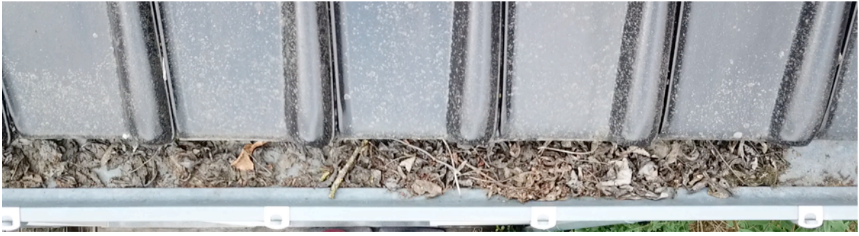
Fig. 10. Gouttière sud bâtiment bas 2.