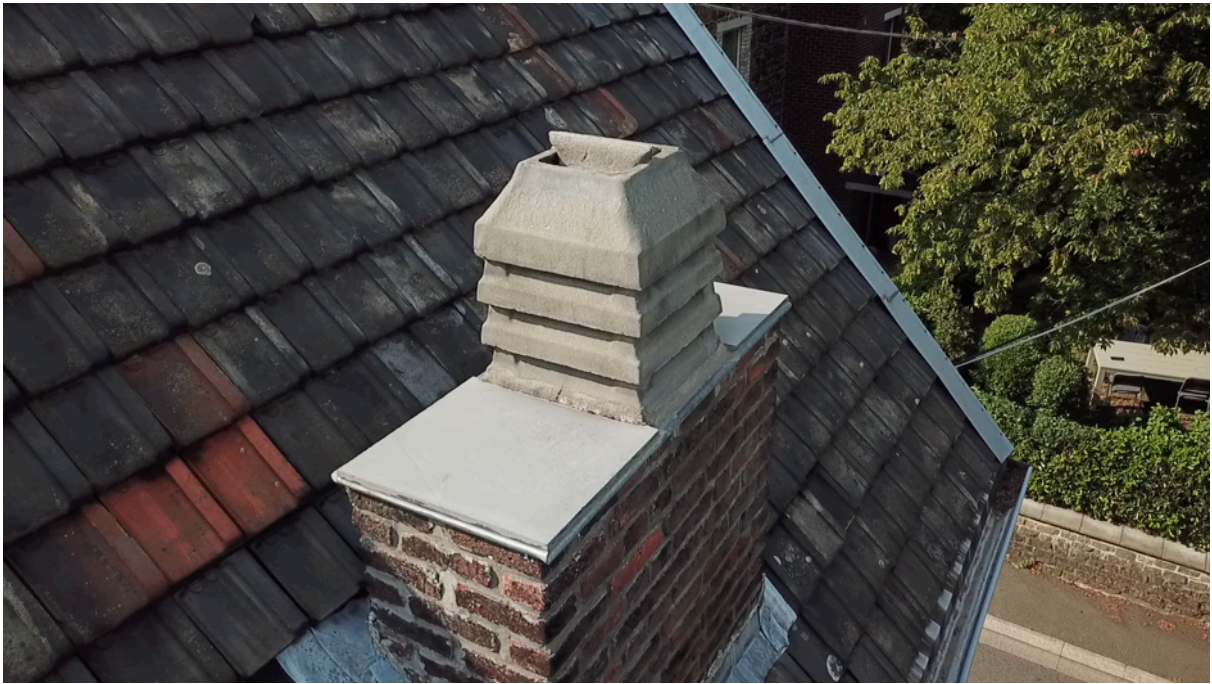
Fig. 16. Cheminée est 2.