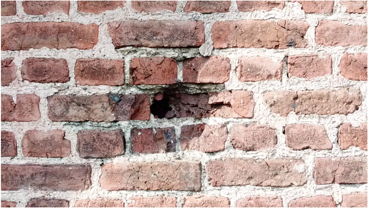
Fig. 29. Impact d'artillerie rapproché mur sud.