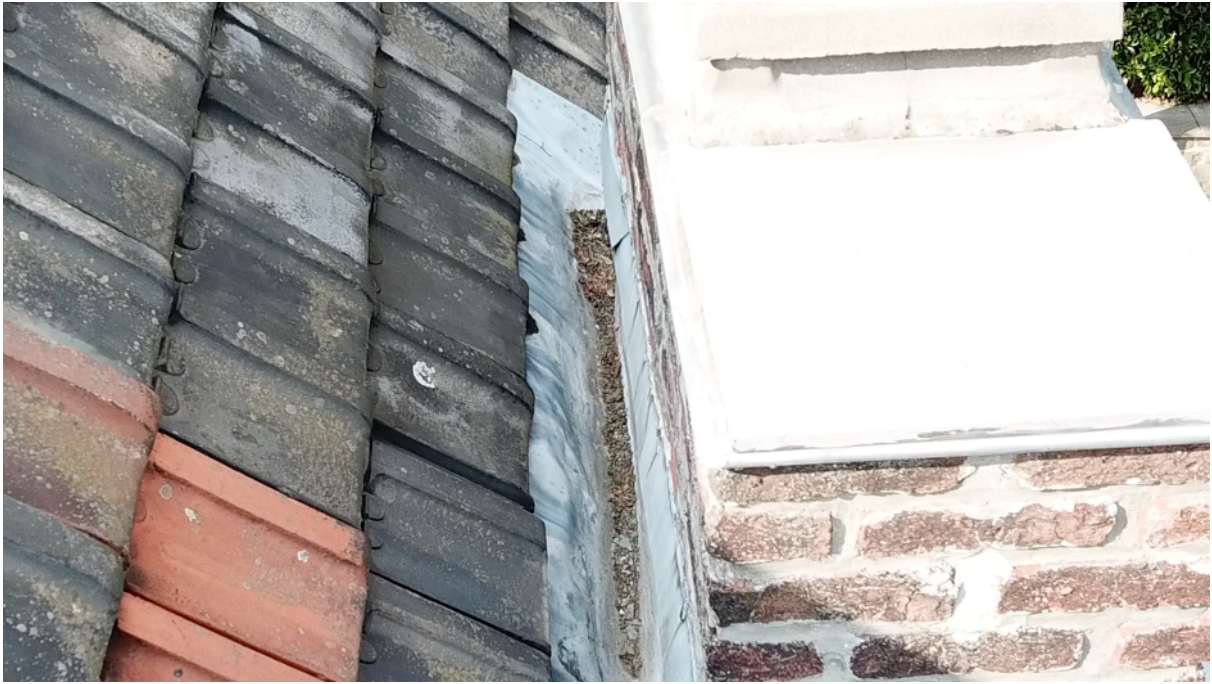
Fig. 19. Cheminée est 5.