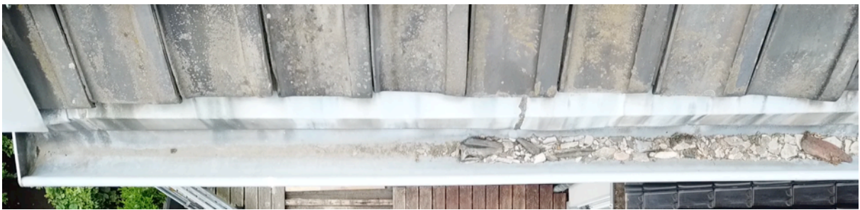
Fig. 12. Gouttière est 1.