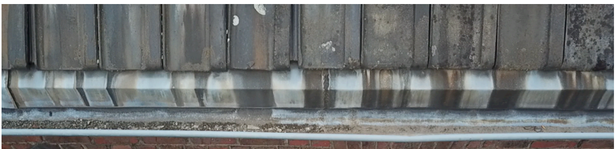
Fig. 14. Gouttière est 3.