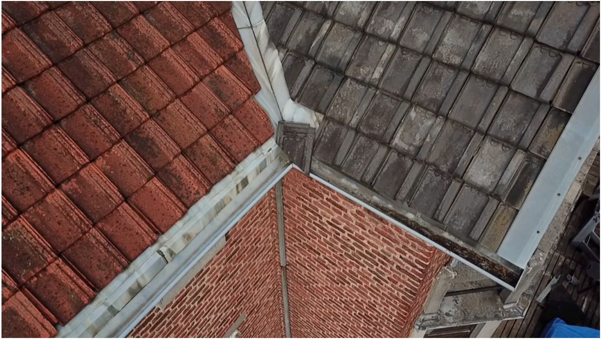
Fig. 3. Tuile 1.