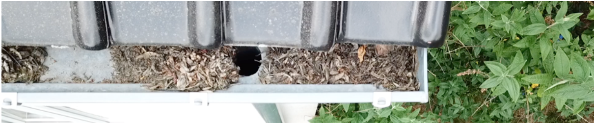
Fig. 11. Gouttière sud bâtiment bas 3.