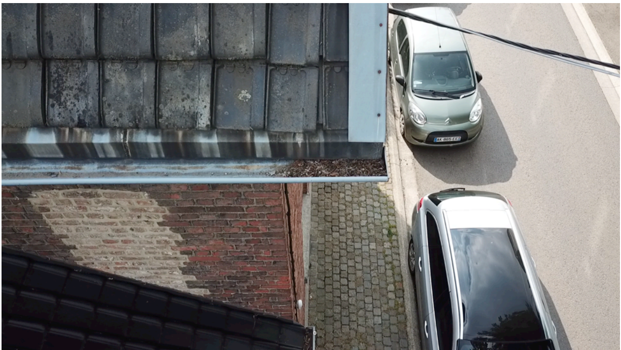
Fig. 20. Gouttière est.