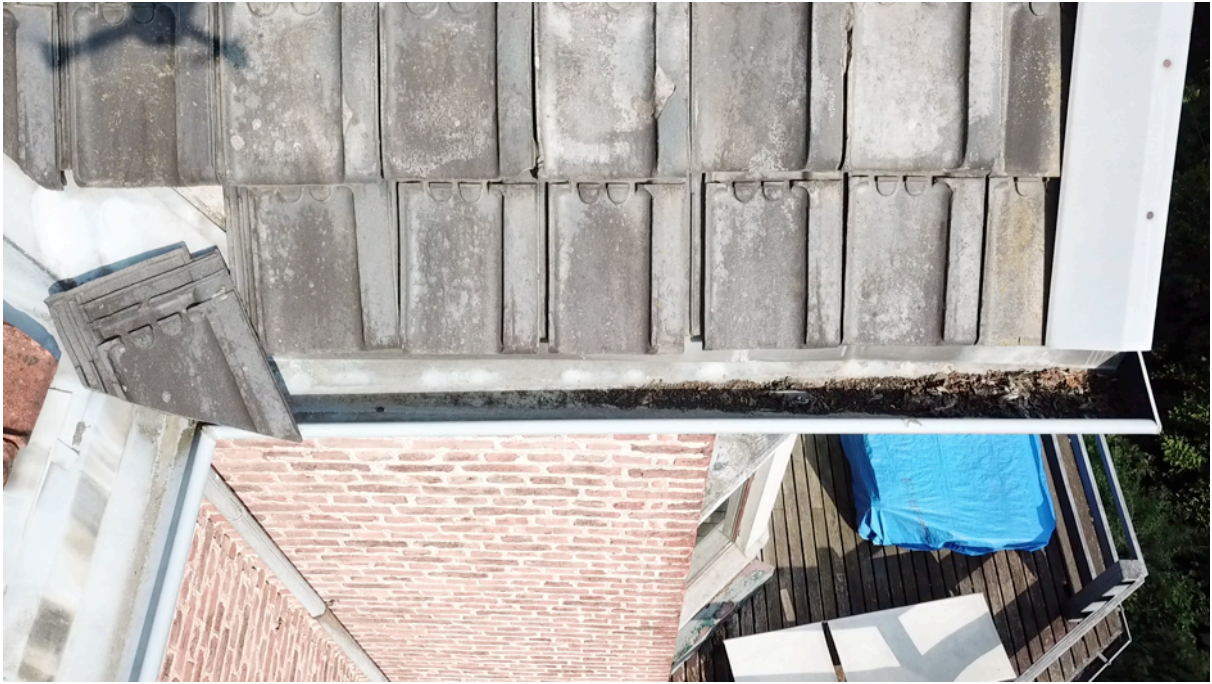
Fig. 27. Gouttière ouestsud.