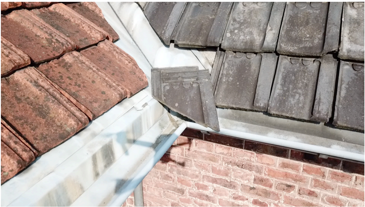
Fig. 26. Tuile sud 3.