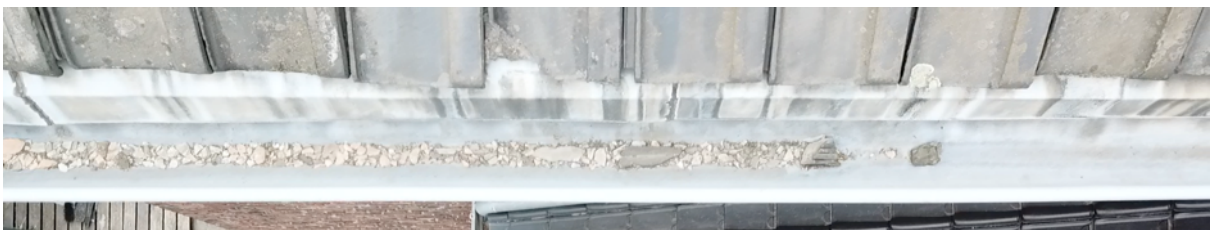
Fig. 13. Gouttière est 2.