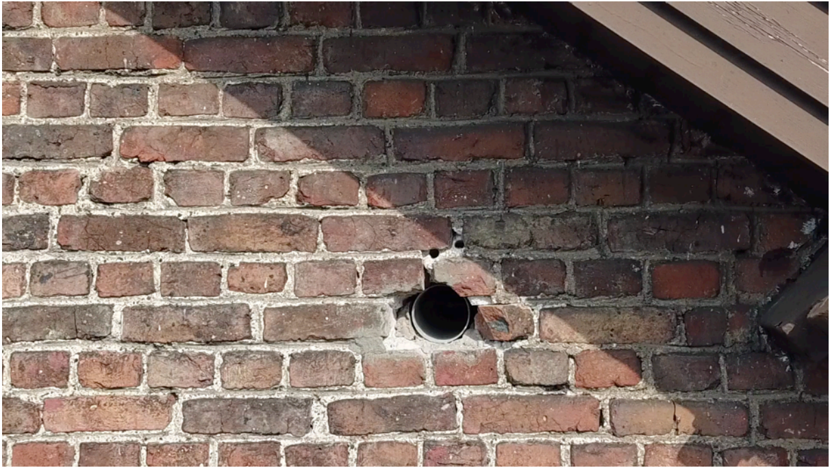
Fig. 31. Bouche d'extraction mur ouest.