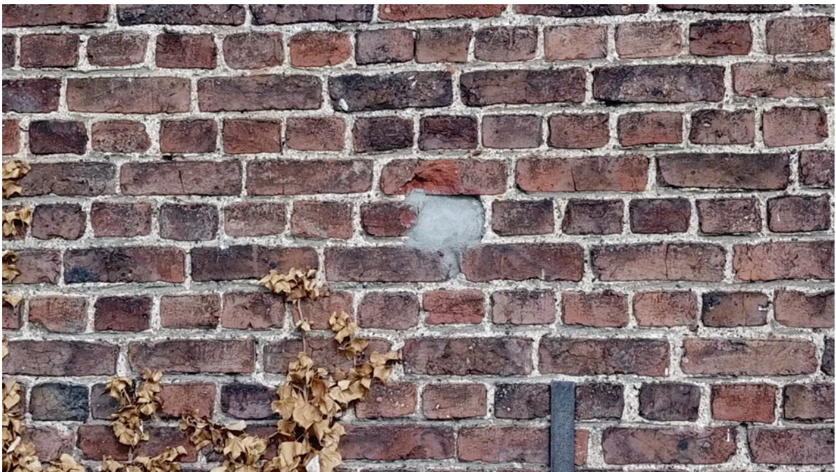
Fig. 30. Percement colmaté mur ouest.