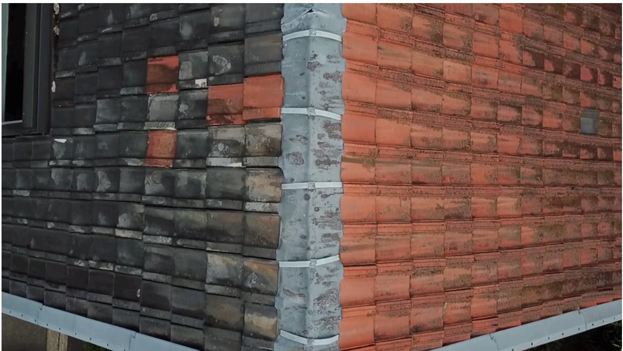
Fig. 6. Faite ouest bâtiment haut.