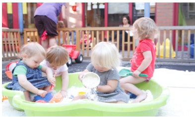
Ils jouent avec du sable dans les bacs

Ensuite, la puéricultrice pense que disposer d'un espace extérieur composé d'objets diversifiés lui permet d'offrir une multitude de possibilités de jeux aux enfants. Elle observe en effet que ceux-ci se promènent avec les cuillères de la dinette, utilisent les bacs extérieurs de différentes façons et montent parfois sur le module avec leurs vélos.