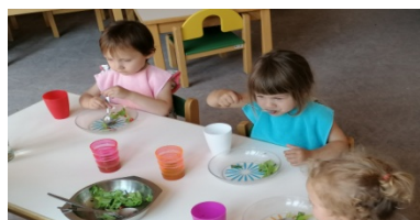
Les enfants mangent la salade du potager