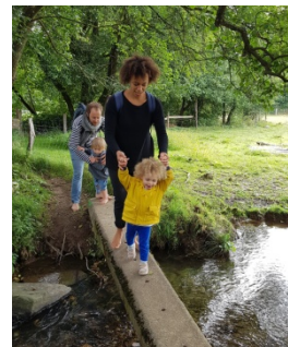
Les parents accompagnent leur enfant dans ses activités