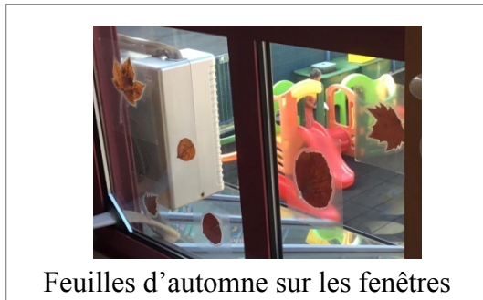
Feuilles d'automne sur les fenêtres

La puéricultrice a aussi placé des ballons ou des feuilles d'automne sur les vitres à l'intérieur des services. Ces feuilles sont mises au niveau des enfants pour qu'ils puissent les toucher et les observer. Elle en a également fait pendre aux plafonds.