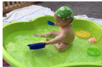
Ils jouent avec de l' eau dans les bacs

En outre, les enfants adorent frapper partout dans la cour avec divers objets (et évitent ainsi de frapper sur les fenêtres). Ils entraînent leur motricité et éveillent leurs sens. Les pontons en bois placés dans la cour permettent aussi aux enfants d'utiliser les voitures de différentes manières: marcher ou rouler.