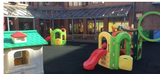
Cour des grands