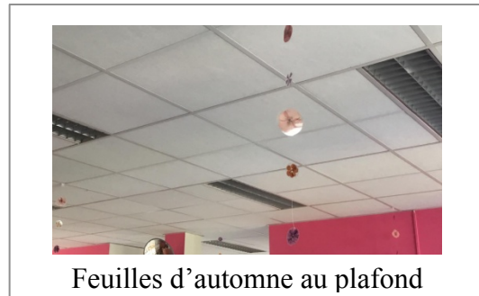
Feuilles d'automne au plafond