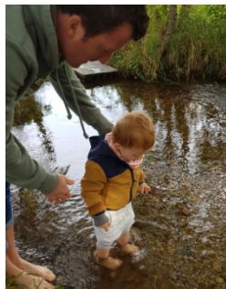
Le parent accompagne son enfant dans ses découvertes

Enfin, la puéricultrice encourage la participation des parents à ces sorties afin de réaliser davantage de partenariat avec les familles, ce qui fait notamment parties des objectifs que les responsables de la crèche se sont fixés. La puéricultrice peut dès lors instaurer une relation privilégiée avec les parents et permettre de renforcer le lien entre les parents et leurs enfants. Par ailleurs, lorsque les parents sont présents lors d'une de ces sorties, la puéricultrice leur laisse la surveillance de leurs enfants. Elle estime en effet dans ce cas que c'est leur rôle de faire des remarques à leurs enfants. Elle n'interviendra que si les parents l'y invitent ou si elle a leur consentement.