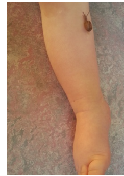
L'enfant apprend à ne pas avoir peur des animaux