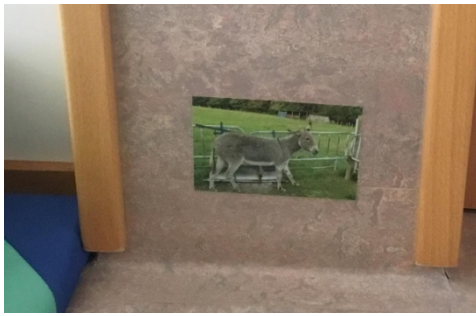
La puéricultrice a mis la photo d'un âne à hauteur de l'enfant pour qu'il puisse l'observer