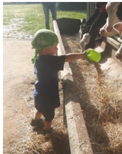
L'enfant apprend à s'occuper d'un animal lors d'une sortie à la ferme