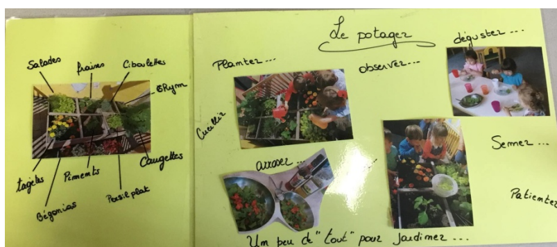
Les puéricultrices ont créé un panneau qui est affiché dans le hall d'entrée de la crèche pour présenter les enfants en activités dans le potager.

Par contre, la puéricultrice se rend compte qu'elle manque d'aide pour la surveillance de l'espace extérieur. Pour cette raison, elle empêche les enfants d'accéder au potager en dehors des activités qui y sont dédiées.