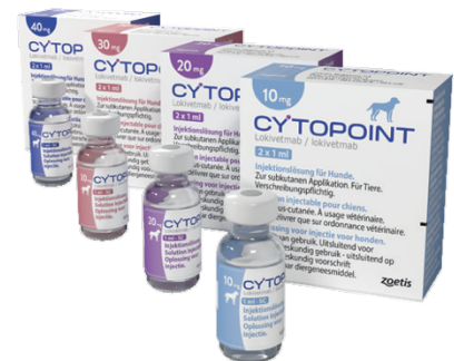
Figure 2 : conditionnement du Cytopoint

Il est également contre-indiqué chez les chiens pesant moins de 3kg ou pour des chiens présentant une hypersensibilité au principe actif ou à un des excipients (RCP Cytopoint® Zoetis).