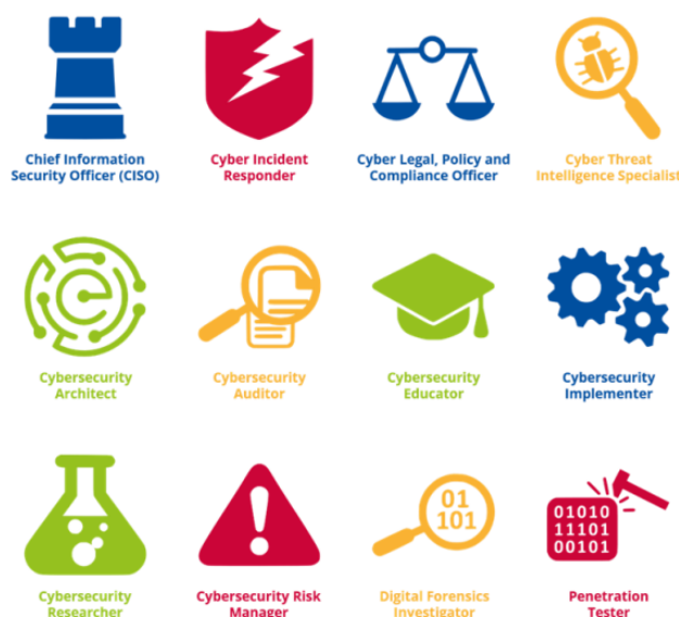
Figure 1: Les 12 profils de rôle du ECSF pour les professionnels de la cybersécurité 3

Le ECSF est basé sur des études de marché récentes, la collaboration d'experts en cybersécurité et une analyse du paysage plus large des cadres de cybersécurité et des TIC 2 . Il exprime donc les besoins pertinents du marché européen. Le ECSF est composé d'un ensemble représentatif de 12 profils de rôles pour les professionnels de la cybersécurité (fig.1) qui sont généralement requis et utilisés au sein des organisations déployant des professionnels de la cybersécurité. Chaque profil est défini par un modèle commun qui intègre des critères clés (c'est-à-dire le titre, les titres alternatifs, l'énoncé de résumé, la mission, les principales tâches, les compétences clés, les connaissances clés, les e-compétences). Le contenu de chaque critère est adapté à chaque rôle, mais il peut être adapté pour permettre une mise en œuvre flexible afin de répondre à des situations et des besoins spécifiques (ENISA, 2022).