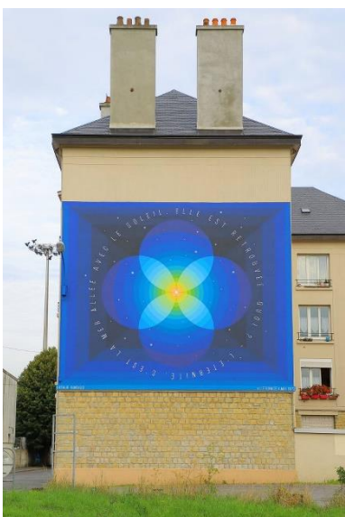
Figure 22 : fresque « L'Éternité »