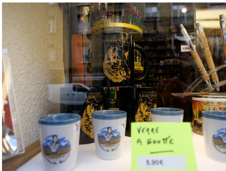
Figure 31 : vitrine d'un magasin de souvenirs