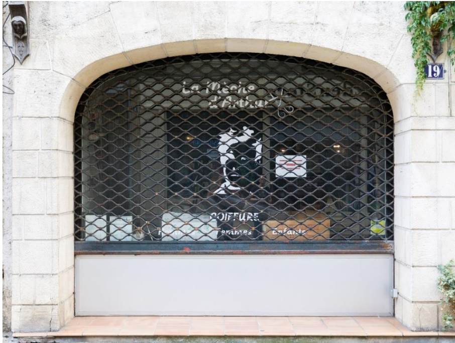
Figure 25 : salon de coiffure « La mèche d'Arthur »