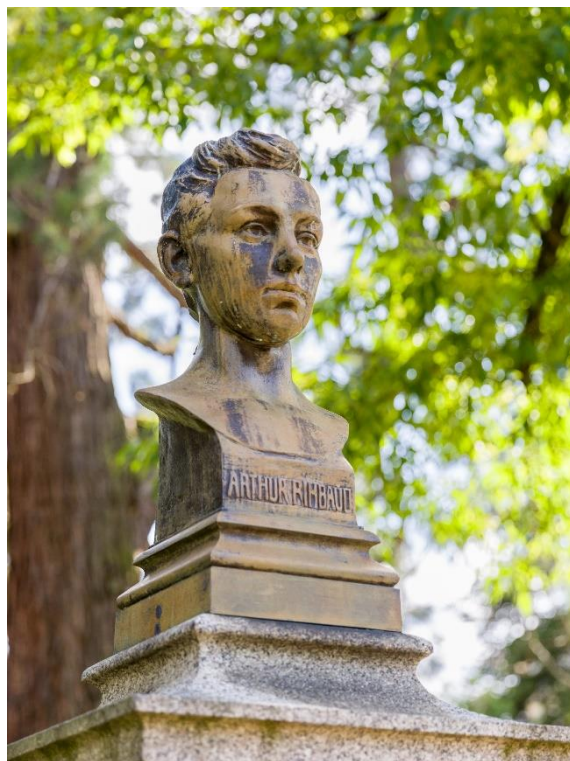
Figure 17 : le buste d'Arthur Rimbaud au square de la gare

Le buste d'Arthur Rimbaud se trouve au square de la gare (voir photographie ci-dessous). Il est visible dès la sortie de la gare et se trouve près du kiosque, dont on dit qu'il est celui du poème « À la musique ». Rimbaud est célébré pour la première fois à Charleville-Mézières, en 1901, dix ans après sa mort, lors de l'inauguration de ce buste. Il a été réalisé par Paterne Berrichon, à la demande de la Société des Écrivains Ardennais. Il est fondu 398 durant la Première Guerre mondiale pour construire des armes et des munitions, tout comme le deuxième. Aujourd'hui, il s'agit de sa troisième version qui trône au square de la gare 399 .