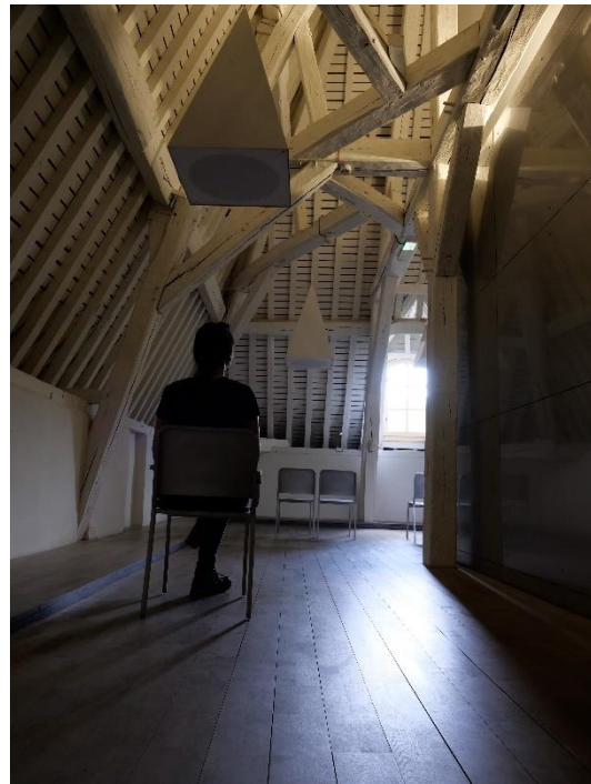
Figure 3 : le « grenier »

La visite du nouveau musée débute par le « grenier » dédié à l'écoute des textes d'Arthur Rimbaud en plusieurs langues (voir photographie ci-contre). Cet espace totalement blanc est la première étape du voyage à la rencontre du poète, qui avait lui-même écrit Une saison en enfer dans le grenier de la ferme familiale de Roche 156 . Le but de cette pièce est de permettre au public de s'imprégner une première fois de l'œuvre de Rimbaud avant de poursuivre le reste de la visite et de reproduire le cadre dans lequel Rimbaud a écrit un de ses recueils. Nous constatons que les textes ne sont pas écrits ou