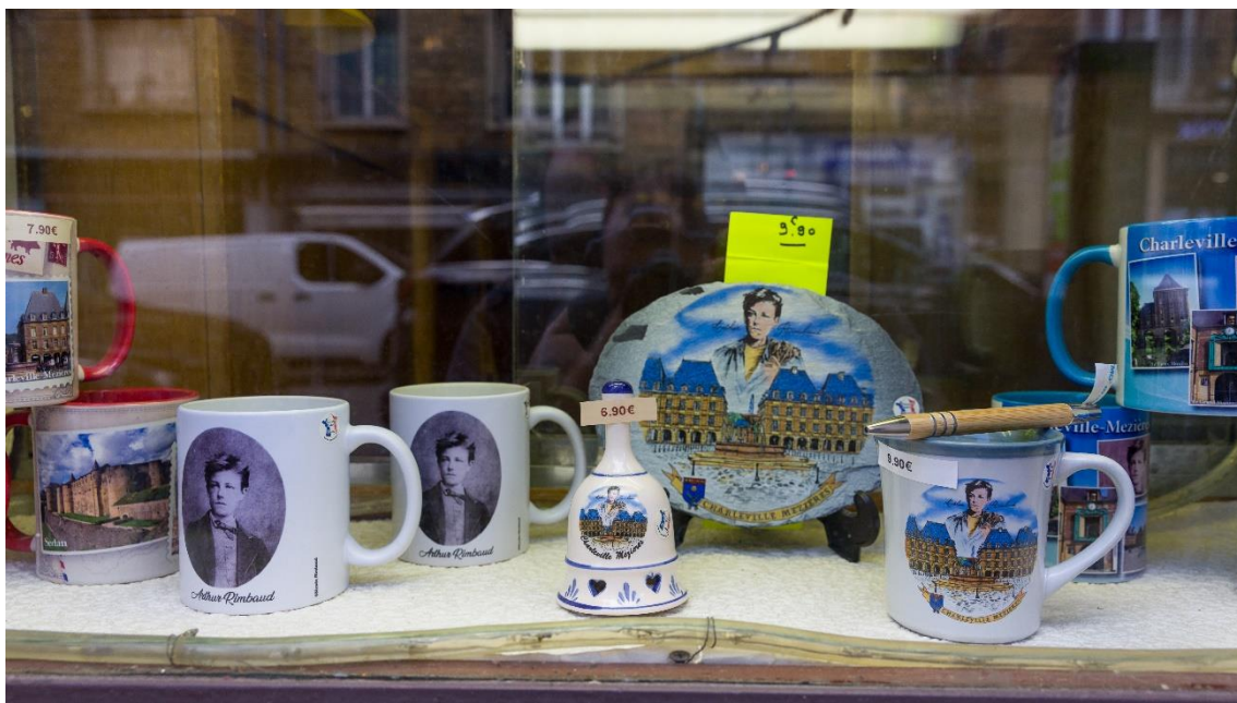
Figure 30 : vitrine d'un magasin de souvenirs