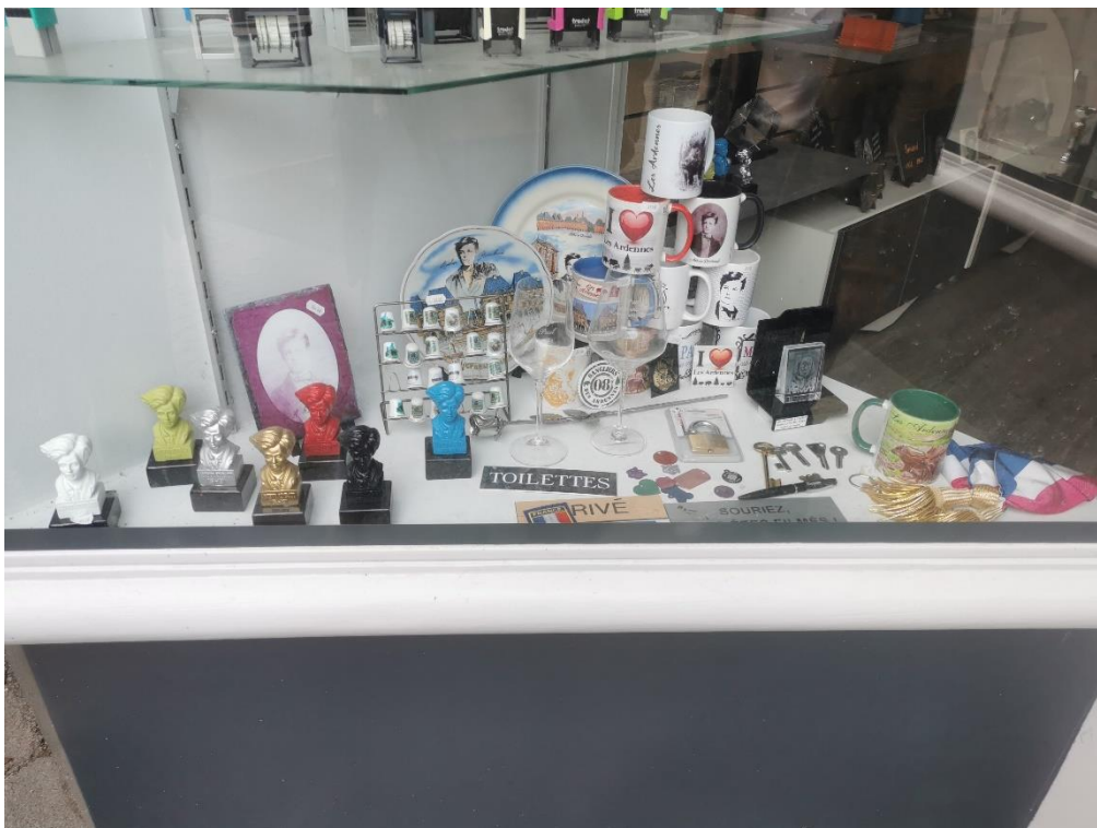
Figure 33 : vitrine d'un magasin de souvenirs