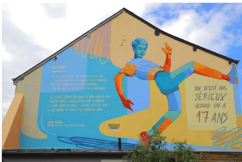
Figure 14 : fresque « Roman »

jeunesse dans cette œuvre colorée, représentant un adolescent, qui pourrait être Rimbaud 310 .