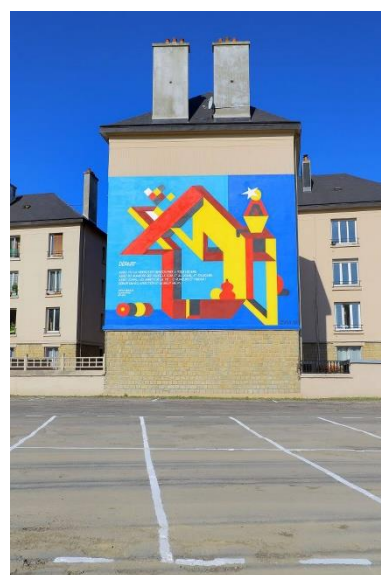
Figure 21 : fresque « Départ »