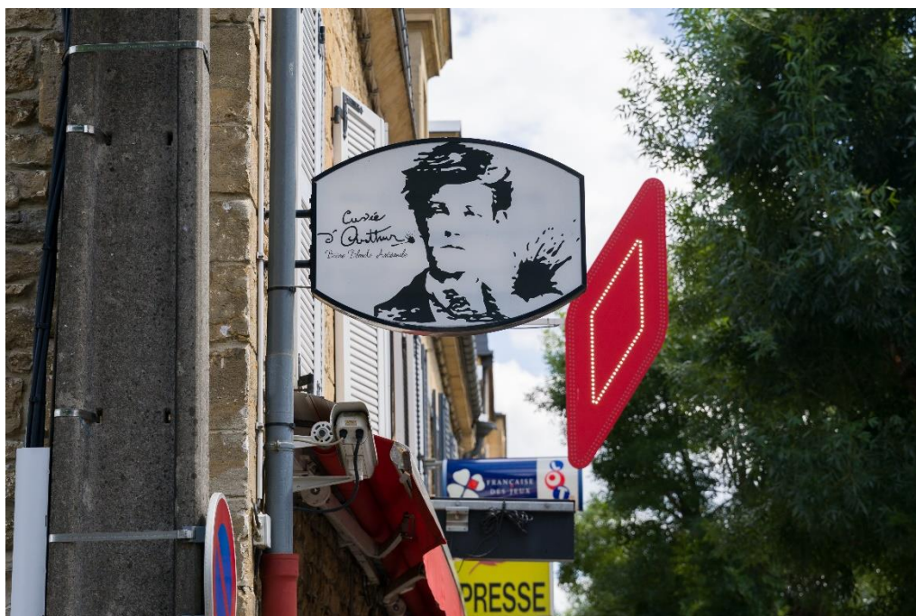
Figure 35 : enseigne « Cuvée d'Arthur »