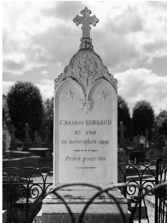
Figure 36 : zoom sur la tombe Arthur Rimbaud