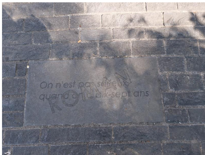
Figure 18 : exemple de dalle « poétique » du square de la gare

En sortant de la gare, des « dalles-poèmes » sont effectivement visibles au sol. Il s'agit d'extraits de poèmes comme « Départ », « Sensation », « L'impossible », « Roman » (voir photographie ci-contre), « Alchimie » qui sont « sloganisés », ou bien d'une ou deux strophes d'autres poèmes comme le « Bateau ivre » ou