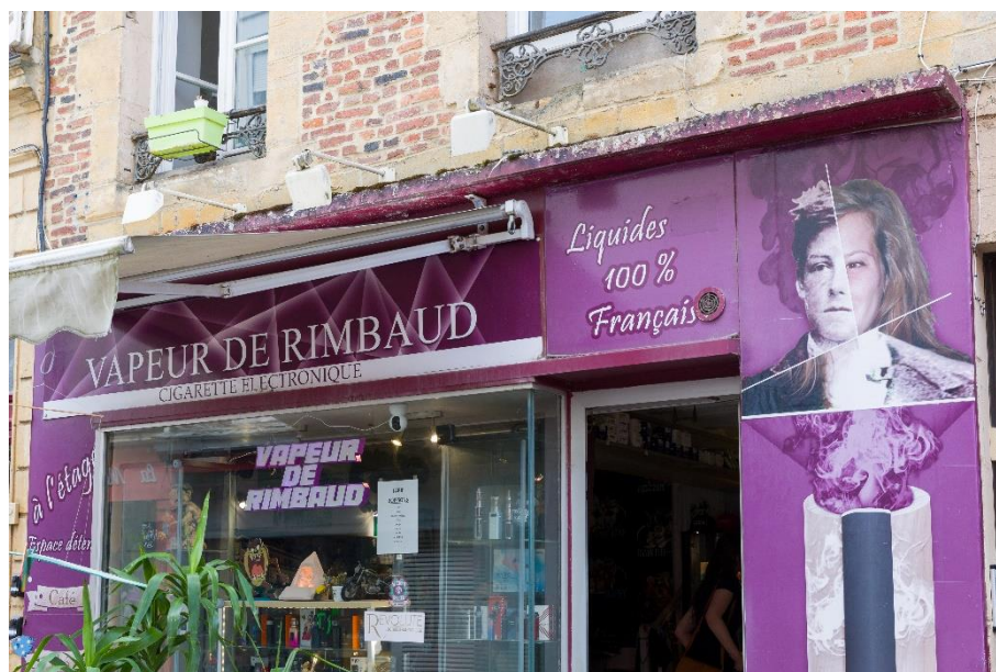
Figure 24 : commerce de cigarettes électroniques « Vapeur de Rimbaud »