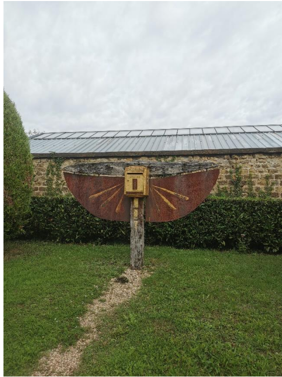
Figure 16 : boîte aux lettres d'Arthur Rimbaud

La boîte aux lettres Rimbaud participe de nouveau au « fétichisme rimbaldien » à Charleville. D'une certaine façon, elle rend également le poète encore présent sur le territoire, comme en témoignent les dires du facteur : « J'ai toujours dit que je n'étais pas une vedette. J'ai travaillé pour Rimbaud, comme j'ai travaillé pour tous mes clients. J'ai jamais fait de différence 395 . ». Rimbaud apparaît réellement comme un habitant de Charleville-Mézières.