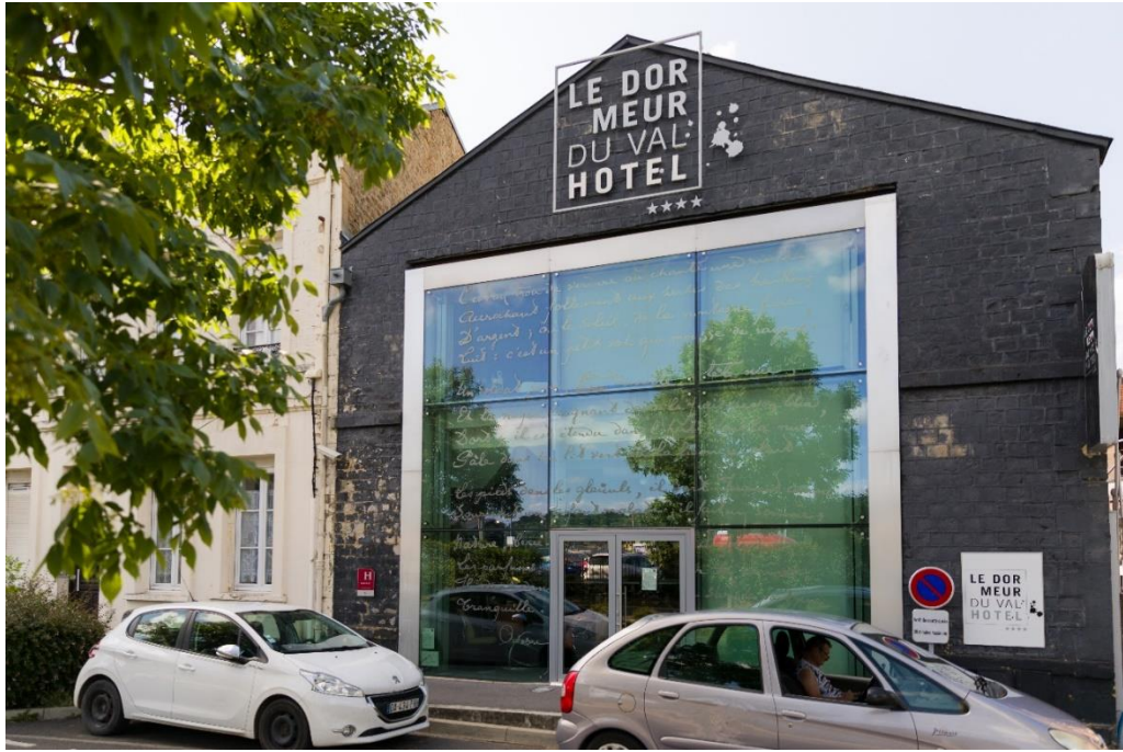
Figure 29 : hôtel « Le Dormeur du Val »