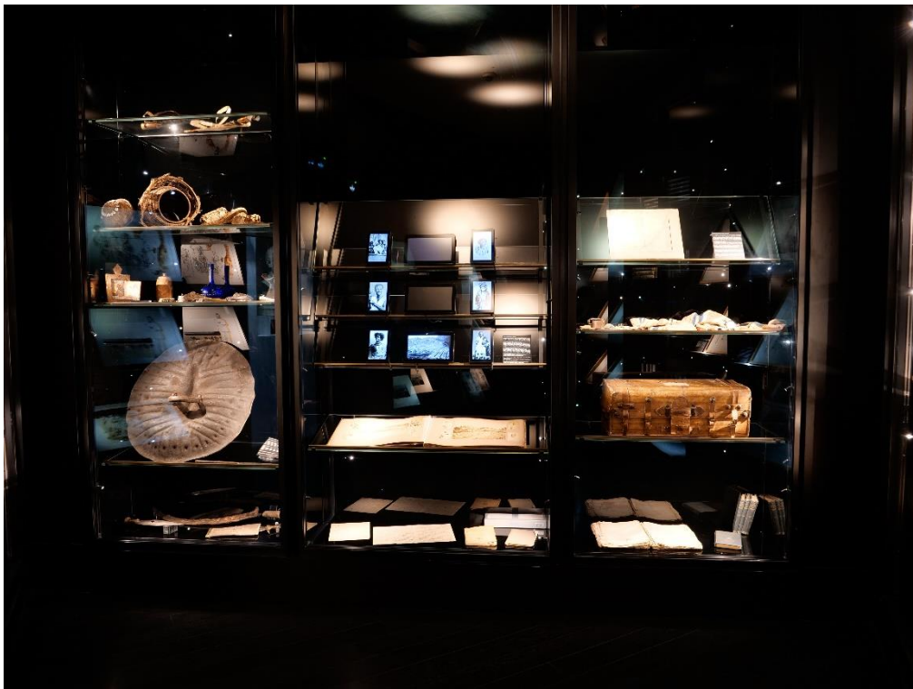
Figure 7 : la salle « voyages »

Le visiteur pénètre enfin dans la salle « voyages », qui prend une part importante de la visite. Comme son nom l'indique, elle évoque les voyages de Rimbaud en Europe ainsi que ceux vers l'Afrique. Elle forme un véritable contraste avec la « dimension ardennaise 164 » installée dans les salles précédentes. En effet, dans ces dernières, les panneaux explicatifs insistaient beaucoup sur l'enfance de Rimbaud à Charleville et sur ses retours dans sa région natale entre ses fugues. Le contenu de la salle « voyages » est renouvelé tous les six mois. Lorsque nous sommes allée à Charleville en juillet 2023, y étaient exposés des œuvres de street art 165 , notamment d'Ernest Pignon-Ernest, qui représentent Rimbaud dans les rues à travers le monde. Cette salle est aussi pourvue d'une pièce intégralement dédiée au séjour de Rimbaud en Afrique. Elle reprend des photographies des lieux, les ouvrages qu'il devait lire et des objets personnels qui lui auraient servi au voyage (valise, montre, couverts, etc.) (voir photographie ci-dessous).