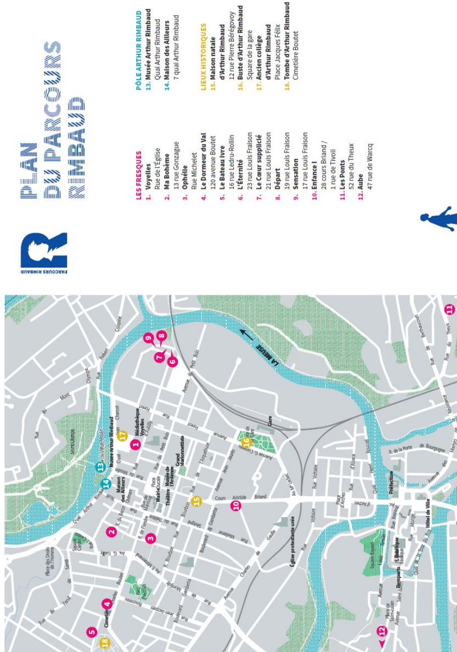
Figure 19 : carte du parcours Rimbaud