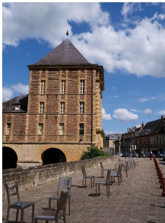
Figure 8 : l'« Alchimie des Ailleurs »

La première activité liée à la poésie à Charleville voit le jour en 2011. Il s'agit des dix-huit chaises-poèmes mises en place à l'issue du projet « Alchimie des Ailleurs » de l'artiste québécois Michel Goulet 216 (voir photographie ci-contre). Ces chaises, qui sont de véritables sculptures contemporaines, relient la maison des Ailleurs au musée Rimbaud. Elles guident le public d'un lieu à l'autre, tout en exposant des extraits de poèmes de Rimbaud mis en relation avec des textes de poètes francophones contemporains (comme Jean-Pierre Verheggen, Pierre-Alain Tâche, Jean-Paul Daoust, Éric Brogniet, Christian Prigent, Jean-Marc Desgent,