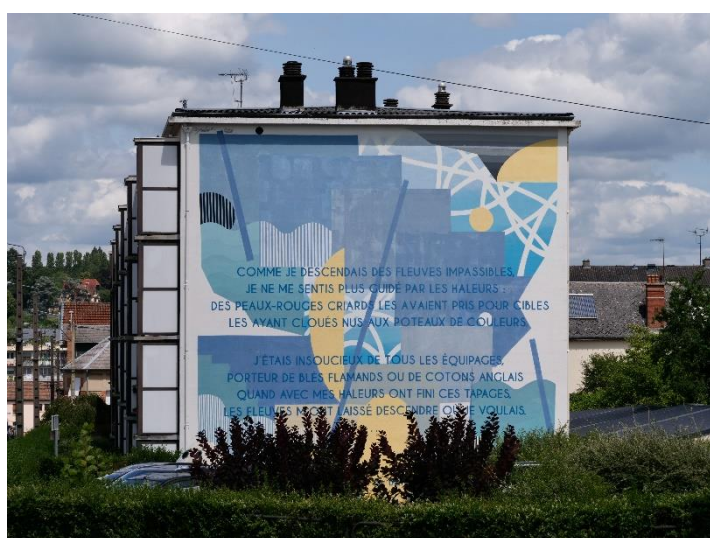
Figure 12 : fresque « Le Bateau ivre »

La fresque suivante représente « Le Bateau ivre » (voir photographie ci-contre). Elle a été réalisée par Polar (Olivier Kenneybrew) sur un immeuble d'habitation de la rue Ledru-Rollin (qui se trouve derrière le cimetière). « Le Bateau ivre » a été composé par Arthur Rimbaud en 1871 et comporte vingt-cinq quatrains en alexandrins. Ici seules les