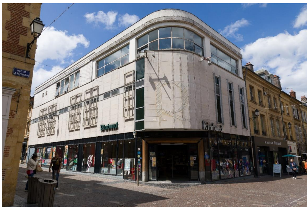
Figure 28 : librairie « Rimbaud »