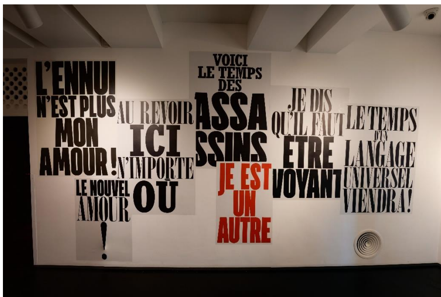
Figure 5 : slogans poétiques sur le mur de la salle « révolutions »

La salle « révolutions » s’ouvre sur un mur complet de slogans poétiques rimbaldiens (voir photographie ci-dessus). Selon Isabelle Roussel-Gillet, il s’agit d’une « instrumentalisation du signal littéraire qui devient un slogan dans l’exposition 160 ». Pour elle, il s’agit d’une forme de « crié littéraire 161 ». L’intention du scénographe était véritablement de transformer la poésie de Rimbaud en slogan. Roussel-Gillet a pu l’interroger et il lui a confirmé cette interprétation : « La poésie en prose de Rimbaud est une poésie de slogans 162 ». Toujours selon Roussel-Gillet, la citation est un signal pour dire qu’il s’agit d’une exposition « littéraire ». La plupart du temps, ces citations sont travaillées comme une « marque ». La « marque Rimbaud » apparaît donc déjà à travers la poésie « sloganisée » de Rimbaud durant la visite du musée.