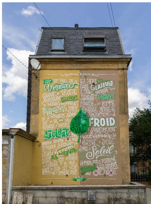
Figure 11: fresque « Le Dormeur du Val »

En 2018, trois autres fresques ont été réalisées grâce à des appels à projet. La première est « Le Dormeur du Val » (voir photographie ci-contre), qui se trouve sur un immeuble d'habitation dans l'avenue Charles Boutet. La fresque a été réalisée par Rodes (Dorian Jaillon). Le poème a été composé en 1870, lorsque le conflit franco-prussien éclate dans les Ardennes 297 . Ce sonnet fait également partie des Cahiers de Douai . De nombreux poèmes représentés sur les fresques sont assez anciens (1870-1871) et n'appartiennent ni aux Illuminations , ni à Une saison en enfer .