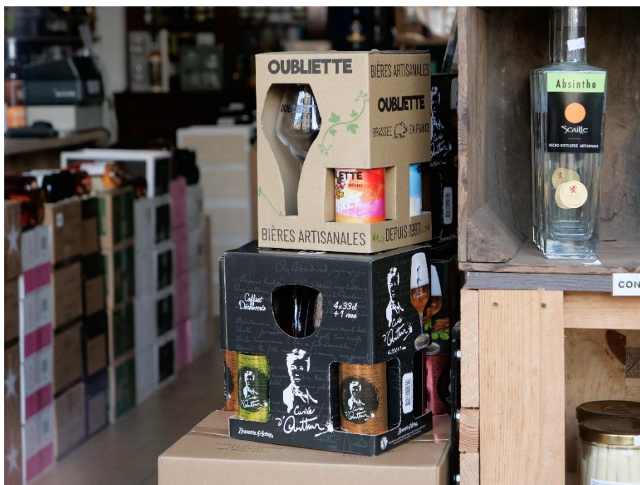
Figure 34 : bières artisanales ardennaises « Oubliette » et « Cuvée d'Arthur » à côté d'une bouteille d'absinthe dans le magasin « Illuminations »