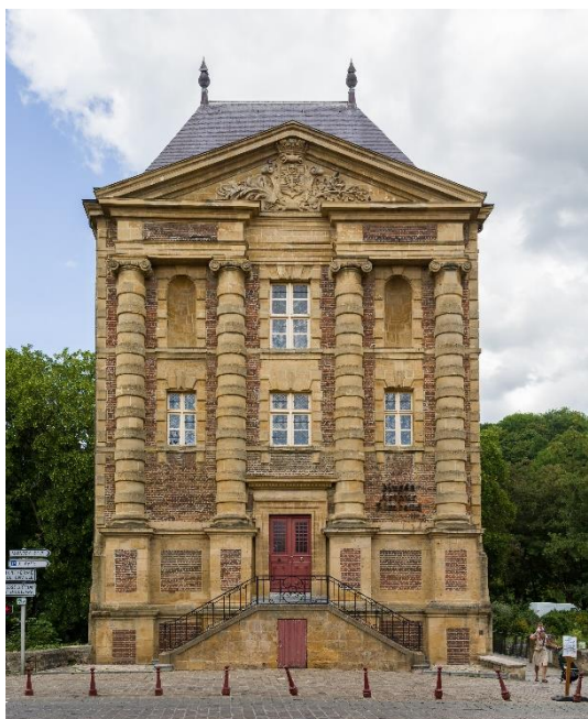
Figure 1 : musée Rimbaud dans le Vieux-Moulin

En 1966, Arthur Rimbaud prend d'autant plus d'importance dans sa région lorsque Charleville et Mézières fusionnent. Le maire de l'époque, André Lebon 128 , a conscience que Rimbaud est le meilleur des ambassadeurs culturels pour sa ville et lui accorde beaucoup d'attention au sein de sa politique culturelle, tout comme le feront ses