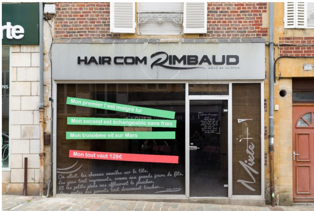
Figure 26 : salon de coiffure « Hair comme Rimbaud »