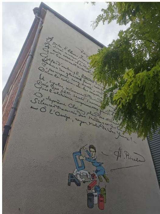
Figure 9 : fresque « Voyelles »

La première fresque conçue en 2015 est consacrée au poème « Voyelles 286 » (voir photographie ci-contre). Elle se trouve sur le flanc de la Médiathèque Voyelles, à quelques mètres du musée Rimbaud 287 . « Voyelles » est un des poèmes les plus célèbres de Rimbaud, mais aussi l'un des plus complexes et mystérieux 288 . Cette fresque a été réalisée par les services municipaux de Charleville. Son but est de rendre visible le poème sur les murs de la médiathèque qui porte son nom et d'en signaler la présence. La fresque est une copie du manuscrit original de « Voyelles » et elle est accompagnée de la reproduction d'une caricature signée du dessinateur Manuel Luque, qui était parue dans la revue Les Hommes d'aujourd'hui en 1888.