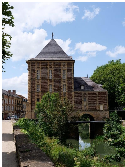
Figure 2 : musée Rimbaud

XVII e siècle, à la demande de Charles de Gonzague, fondateur de la ville en 1606 131 . Ce bâtiment se situe au-dessus de la Meuse (voir photographies ci-contre) et était une des portes d'entrée de la ville à l'époque de Gonzague. Dans ce Vieux-Moulin, les deux grands noms de la ville se rencontrent : Gonzague, son fondateur et Rimbaud, son « promoteur ». Le musée Rimbaud en 1969 n'a cependant toujours pas son espace propre, puisqu'il partage toujours son univers avec d'autres collections d'art et de traditions populaires ardennaises 132 .