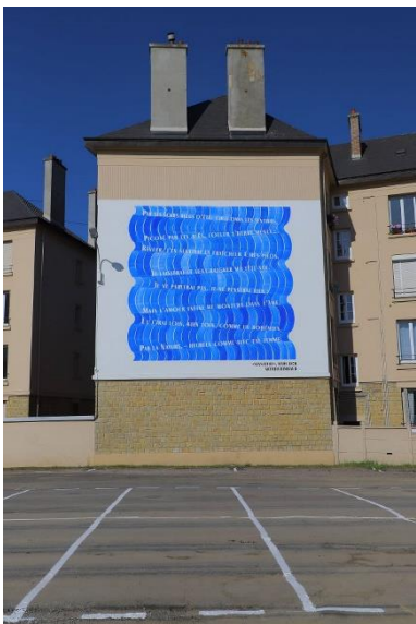
Figure 20 : fresque « Sensation »