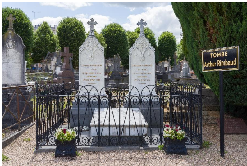
Figure 15 : tombe Arthur Rimbaud

donc à contre-cœur à l'hôpital de la Conception le 3 septembre. Le 9 novembre, la veille de sa mort, Rimbaud demande à sa sœur de rédiger une lettre adressée au directeur d'une compagnie de navigation. Lefrère indique que « les dernières paroles connues de Rimbaud ont donc été un projet de départ 354 » et pas un projet de retour en Ardennes ou à Charleville. Rimbaud s'éteint le 10 novembre 1891 dans sa chambre d'hôpital 355 .