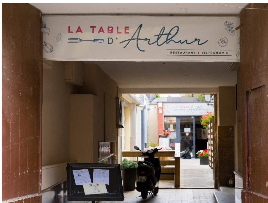
Figure 27 : restaurant « La Table d'Arthur »