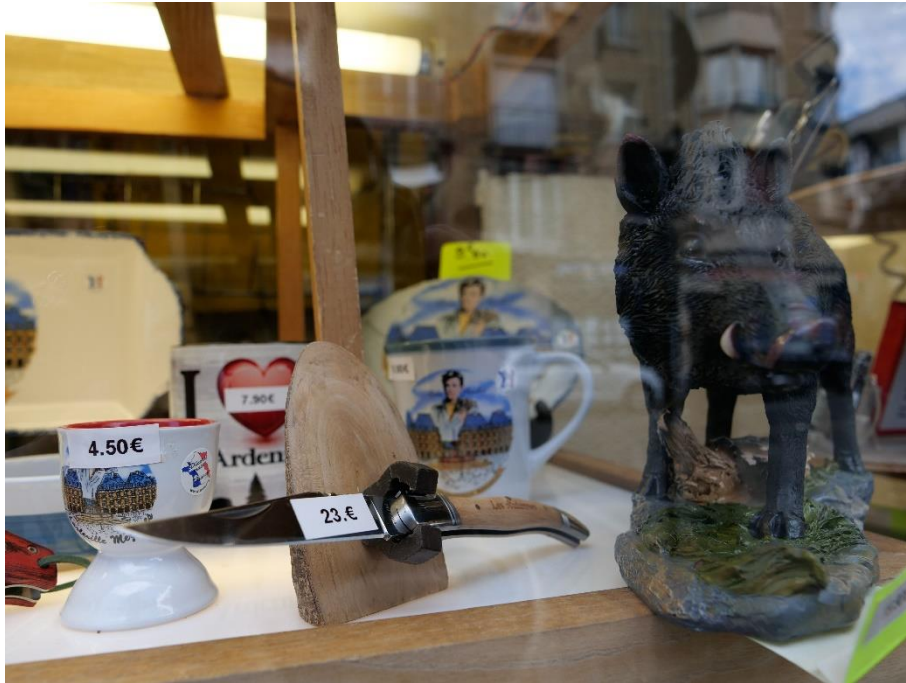
Figure 32 : vitrine d'un magasin de souvenirs