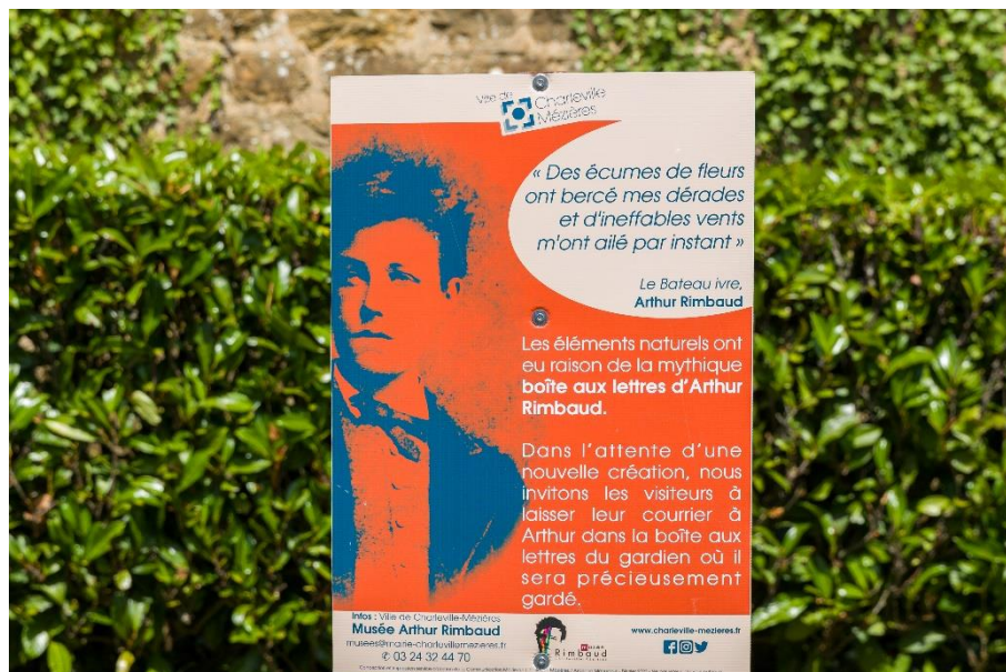
Figure 37 : plaque à la place de la boîte aux lettres Rimbaud