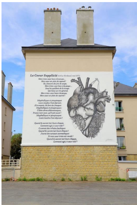
Figure 13 : fresque « Le Cœur supplicié »

Il détourne d'anciennes planches d'anatomie pour transformer le cœur en mécanisme dont on exhibe les engrenages et les pistons. Il invite à réfléchir sur les multiples significations du mot « cœur » : organe vital, noyau irréductible, métaphore du sujet, siège des émotions 307 ... mais laisse de côté l'aspect scabreux du texte. La fresque s'éloigne d'autant plus du texte de Rimbaud, puisque les éléments mécaniques et d'architecture de la fresque font écho au pont ferroviaire et à l'usine Delville tout proches dans le paysage. Ardif a également dissimulé dans sa fresque quatre détails de monuments carolomacériens qu'il est possible d'identifier : la basilique Notre-Dame-d'Espérance, l'église Saint-Rémi, l'hôtel de ville et le musée Rimbaud. La fresque valorise le patrimoine architectural carolopolitain, en associant à nouveau Rimbaud à sa ville natale, sans essayer de rendre réellement accessible le sens du texte au plus grand nombre. La valorisation du patrimoine architectural local dans la fresque serait-elle là pour masquer le côté sulfureux du poème ?