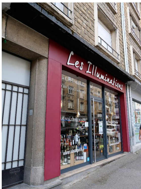
Figure 23 : brasseur « Les Illuminations »