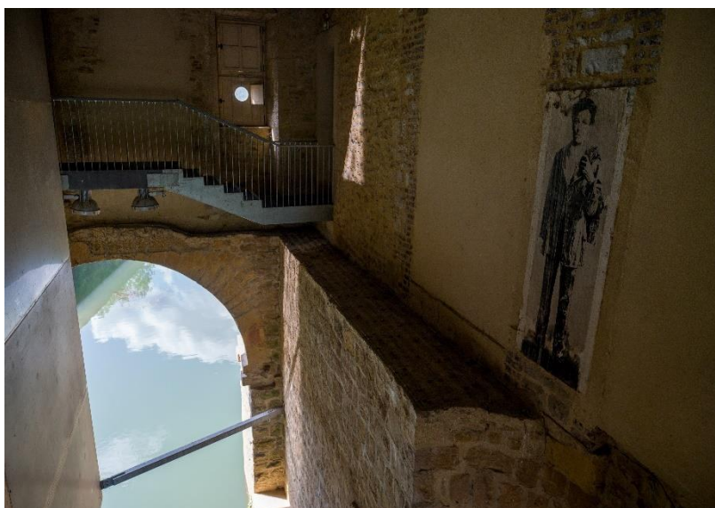
Figure 6 : le « wasserfall »

La visite se poursuit en passant par le « wasserfall », qui est un rappel du « Wasserfall blond » du poème Aube . Le visiteur traverse le Moulin en passant au-dessus de la Meuse, où il peut apercevoir le premier collage à l’effigie d’Arthur Rimbaud réalisé par Ernest Pignon-Ernest à Charleville dans les années 1970 163 (voir photographies ci-dessous).