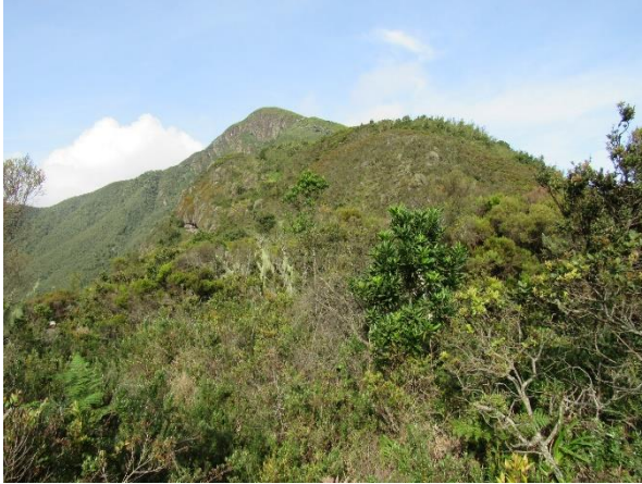
Sommet 3 du mont Kahuzi