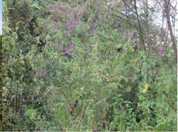
Pied du mont Kahuzi.