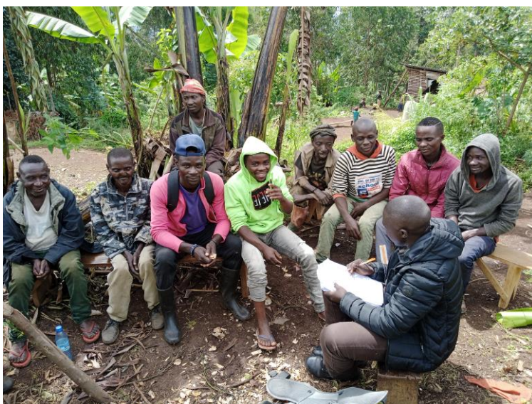
Entretien en focus group des hommes