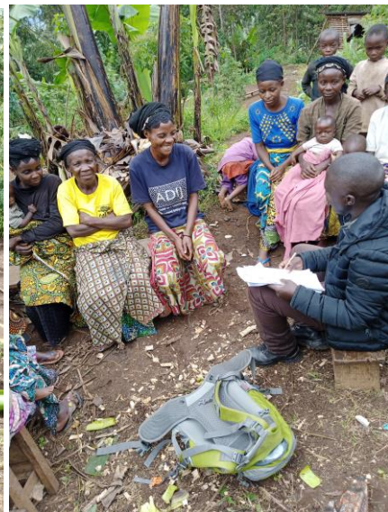
Entretien en focus group des femmes