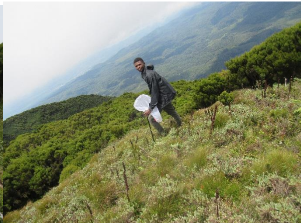
Collecte des abeilles au sommet 4 du mont Kahuzi