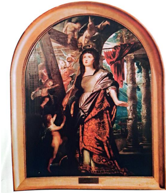
RUBENS, Sainte-Hélène à la vraie Croix , Grasse, Cathédrale Notre-Dame, 1602 (édité par WEPPELMANN S., Rubens : Die Altarbielder für Santa Croce in Gerusalemme in Rom , Münster, Verlag, 1998).