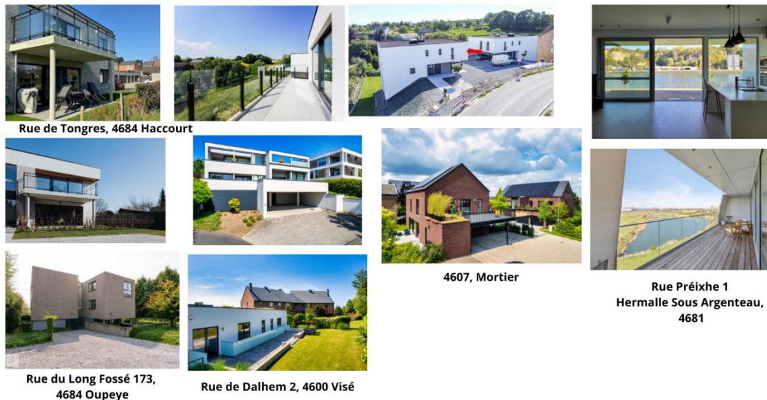
Figure 4 : Annexe photographique des appartements en centralité