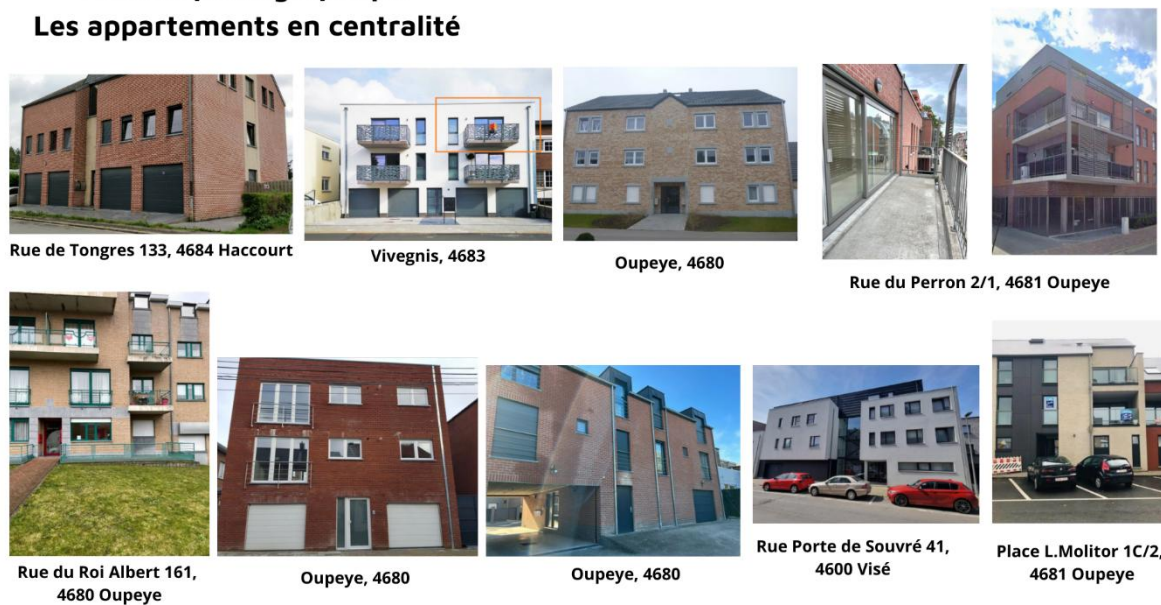
Figure 5 : Annexe photographique des appartements en centralité (source : smartblock.be) (production personnelle, 2025)