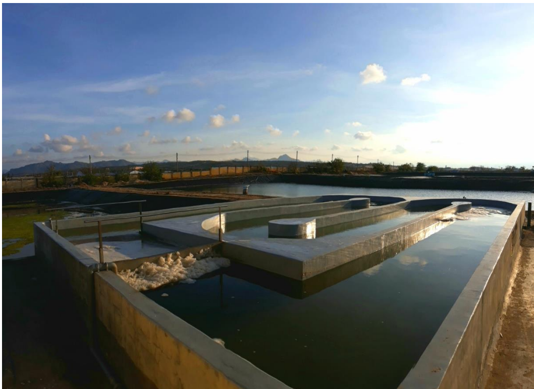
Figure 2 - High Rate Algal Pond installed in Ninh Thuan (Vietnam)