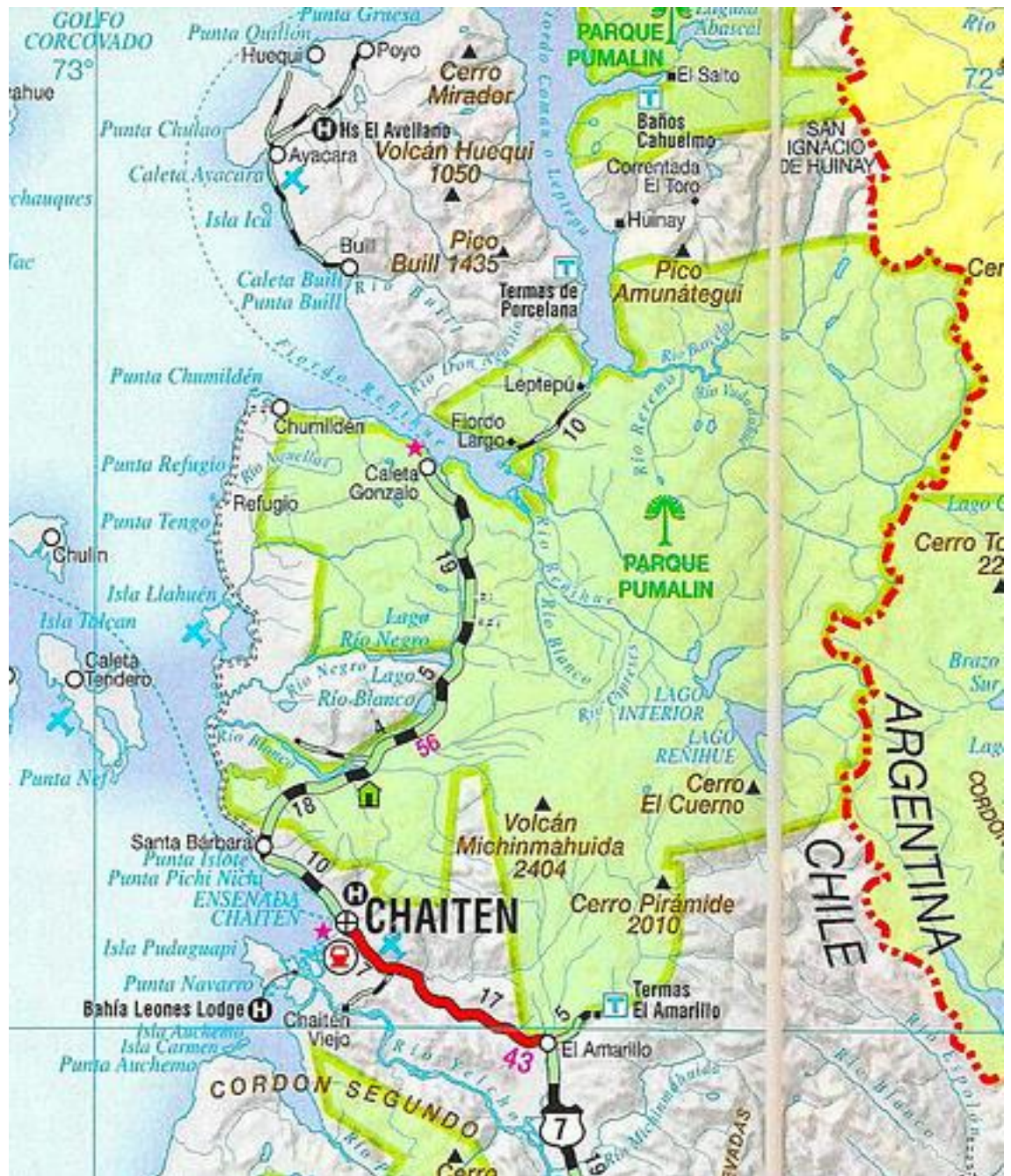
Figure 3 : Carte et photos du parc Pumalín