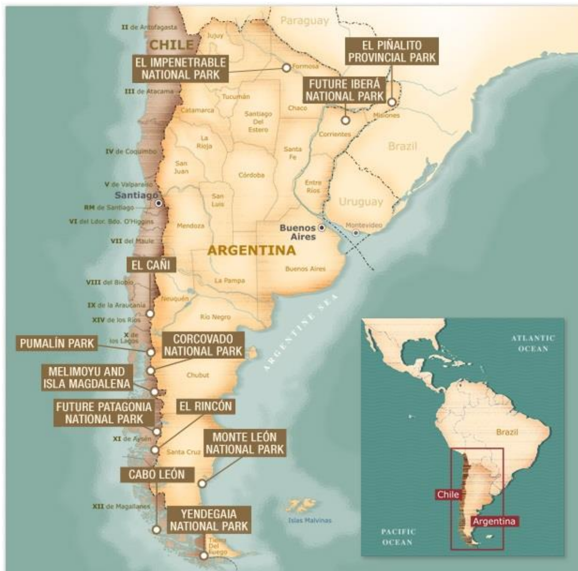
Figure 5 : Création de parcs nationaux de Tompkins Conservation