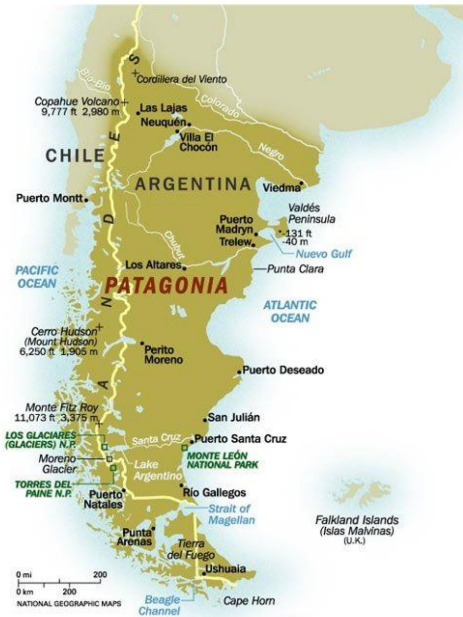
Figure 1 : Carte de la Patagonie