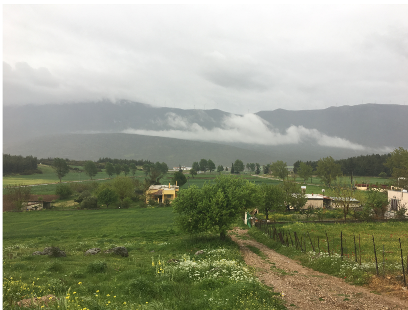
Vue du chemin de la maison de Kaparelli

coup plus petit. Les habitué.e.s du projet se rendent souvent à Erythres, pour leurs petites courses ou prendre un caffè freddo , dans le café d'une jeune grecque très amie avec Kastro et Majed. Les parcelles sont réparties au milieu d'autres champs dans les environs, jamais à plus de 15 minutes en voiture. On y accède par des chemins cabossés, on s'arrête souvent pour dire bonjour aux agriculteurs voisins, on salue les travailleurs agricoles, majoritairement Pakistanais. La région est vallonnée, de hautes collines la coupe du Golfe de Corinthe qui se trouve à une quinzaine de kilomètres de là, au Sud-Ouest. Le climat est méditerranéen, avec des étés très chauds (2018, Beck et al.). Quand on fait référence au lieu et non pas au projet, ce que désigne le « Village », c'est d'abord la première maison, qui maintenant est appelée « la maison de Kaparelli » et maintenant c'est la deuxième maison, acquise courant mai, que l'on désigne ainsi, les champs faisant partie de cette entité.