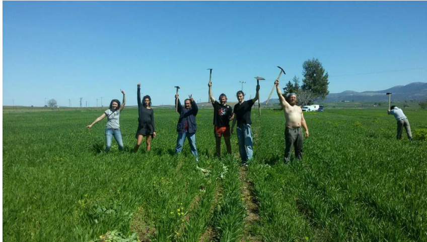
Photo choisie pour les étiquettes des conserves du Refugee Village for Freedom ( https://syrianunitedrefugeefund.org/2017/07/26/refugee-village-for-freedom/ )

Pour ajouter à la rancœur face aux ONG humanitaires, certaines d'entre elles, qui ont pourtant une reconnaissance internationale sont prises dans des affaires de corruption qui touchent directement les populations de réfugiés en Grèce. Par exemple il y en a qui n'hésitent pas à réclamer à l'État, en plus de subventions, des bâtiments occupés illégalement mais rénovés par les squatteurs qui se font évincer violemment pour qu'au final, les ONG n'utilisent même pas ces bâtiments.