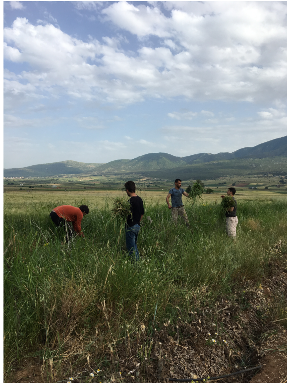
Récoltes de graminées pour nourrir les vaches, L. Chaussebourg (2019)

en place pour y remédier (comme par exemple un temps de parole imparti lors de réunions ou autre). Cependant, un autre avantage des groupes d'affinité soulevé par Dupuis-Déri (2018), c'est que les membres du groupe n'ont pas besoin d'être réunis par une idéologie partisane comme dans le militantisme traditionnel, puisque c'est l'affinité qui guide le comportement politique, c'est-à-dire l'organisation autogestionnaire. Ceci est effectivement un avantage pour le Refugee Village for Freedom, car il peut ainsi regrouper des personnes venant d'horizons très différents.