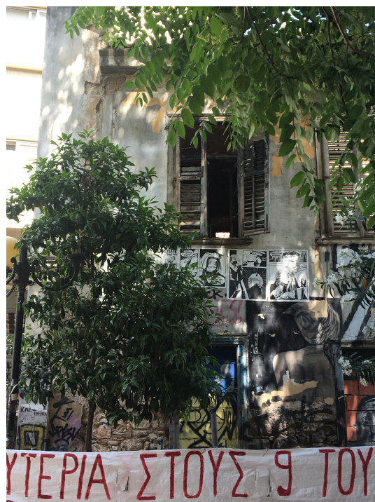
Une rue d'Exarcheia, L.Chausebourg (2019)