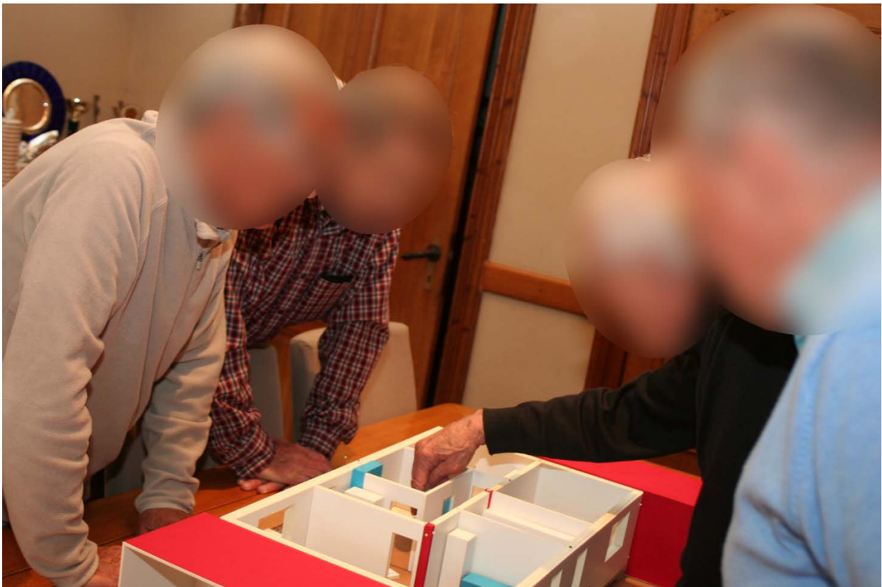
Photographie lors d'un de nos workshops avec des seniors