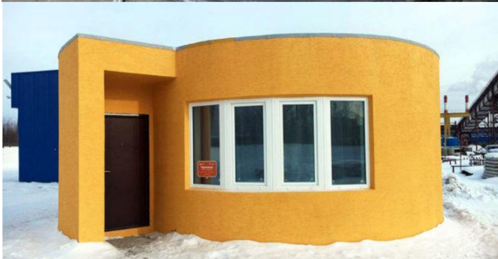
Figure 2: Construction d'une habitation par la technique d'impression 3D béton.