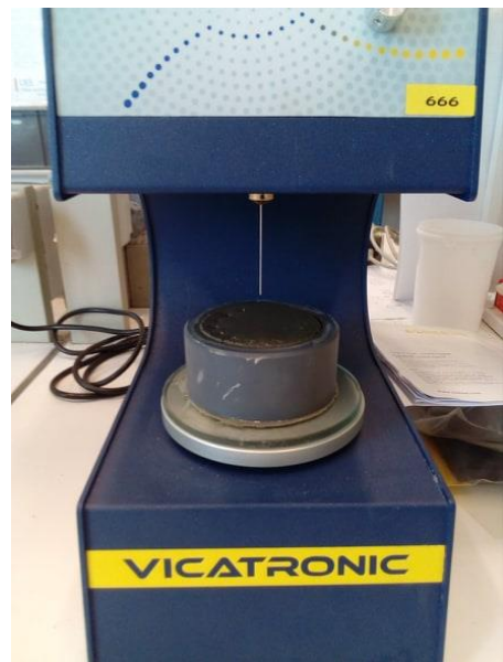
Figure 4: Dispositifs utilisés pour caractériser le mortier à l'état frais.