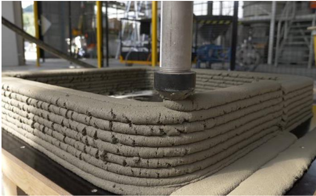
Figure 1: Technique d'impression 3D du béton par extrusion/dépôt.