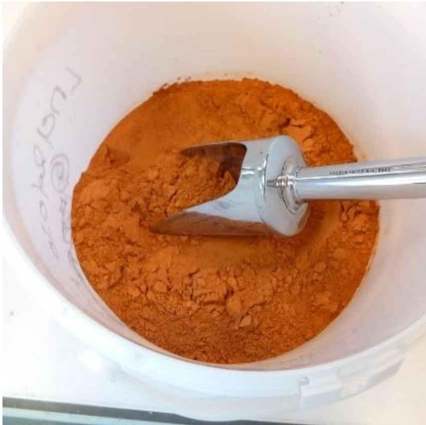
Figure 3: Fines de briques utilisées pour les substitutions.