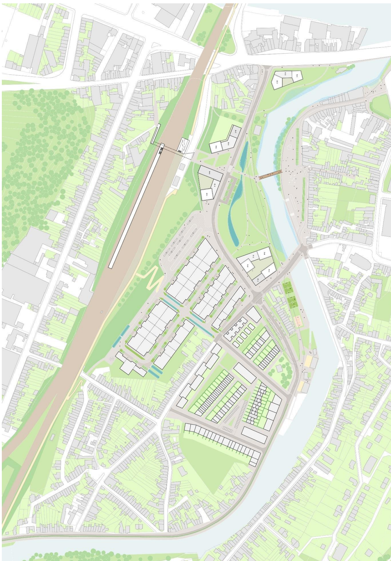
Annexe 7 Masterplan, MSA, Révision du plan de secteur-Périmètre « Chénée – Vesdre » dossier de base, 2021