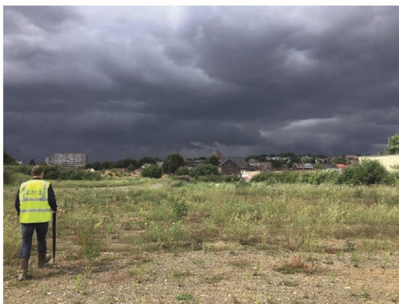
Annexe 6 Photos, MSA, Etude de développement d'une zone - d'activités économiques mixtes sur le site dit « LBP » à Chênée, 2017