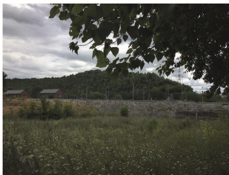
Annexe 5 Photos, MSA, Etude de développement d'une zone - d'activités économiques mixtes sur le site dit « LBP » à Chênée, 2017