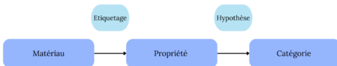
Figure 1 - Du matériau à la catégorie - Reproduit à partir de « Manuel d'analyse qualitative : Analyser sans compter ni classer », par Lejeune, C., 2019, p.64, De Boeck Supérieur.