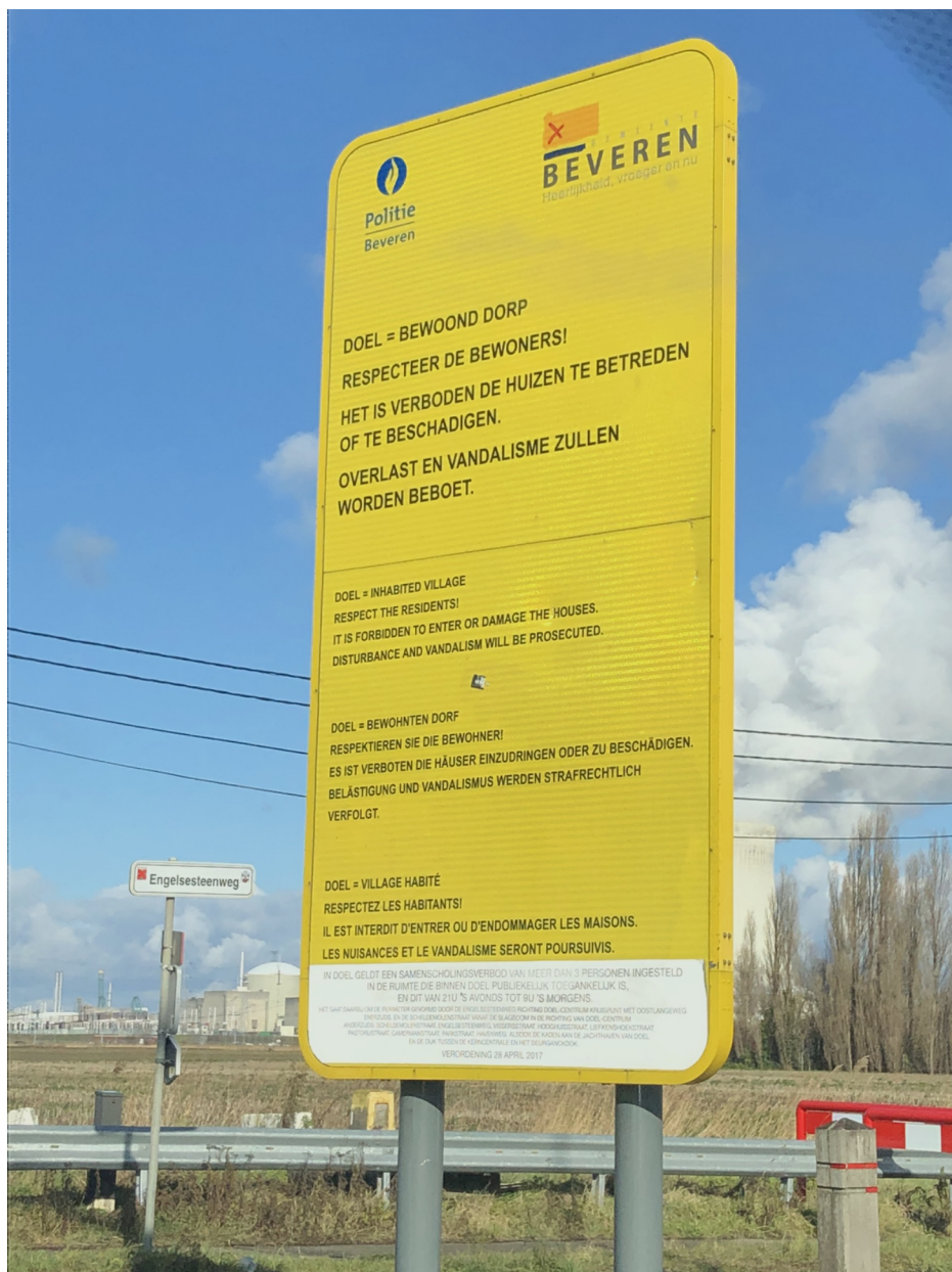
Fig. 29 : panneau à l'entrée du village de Doel.