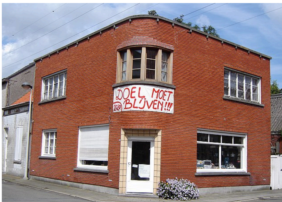
Fig. 6 : photo d'une maison de Doel.