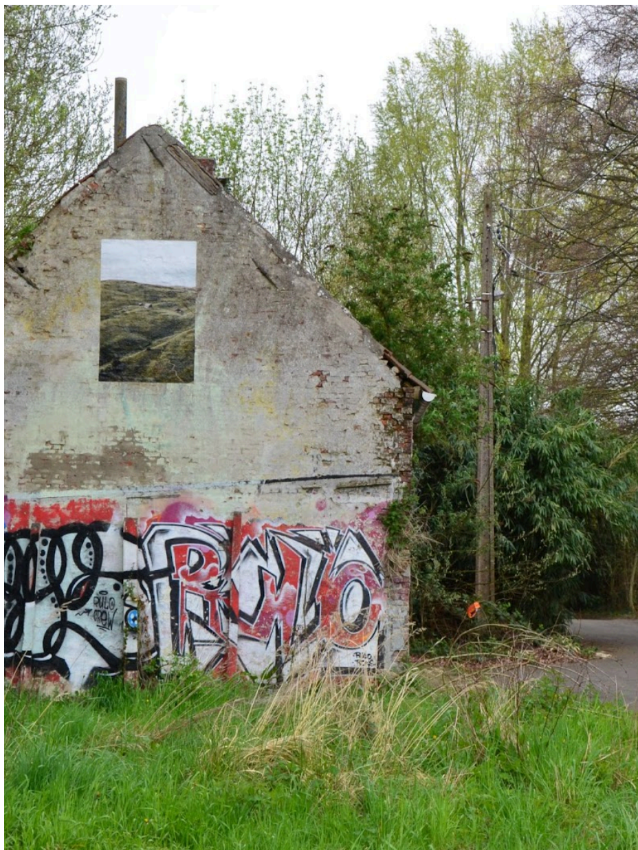
Fig. 44 : photo d'une façade à Doel.