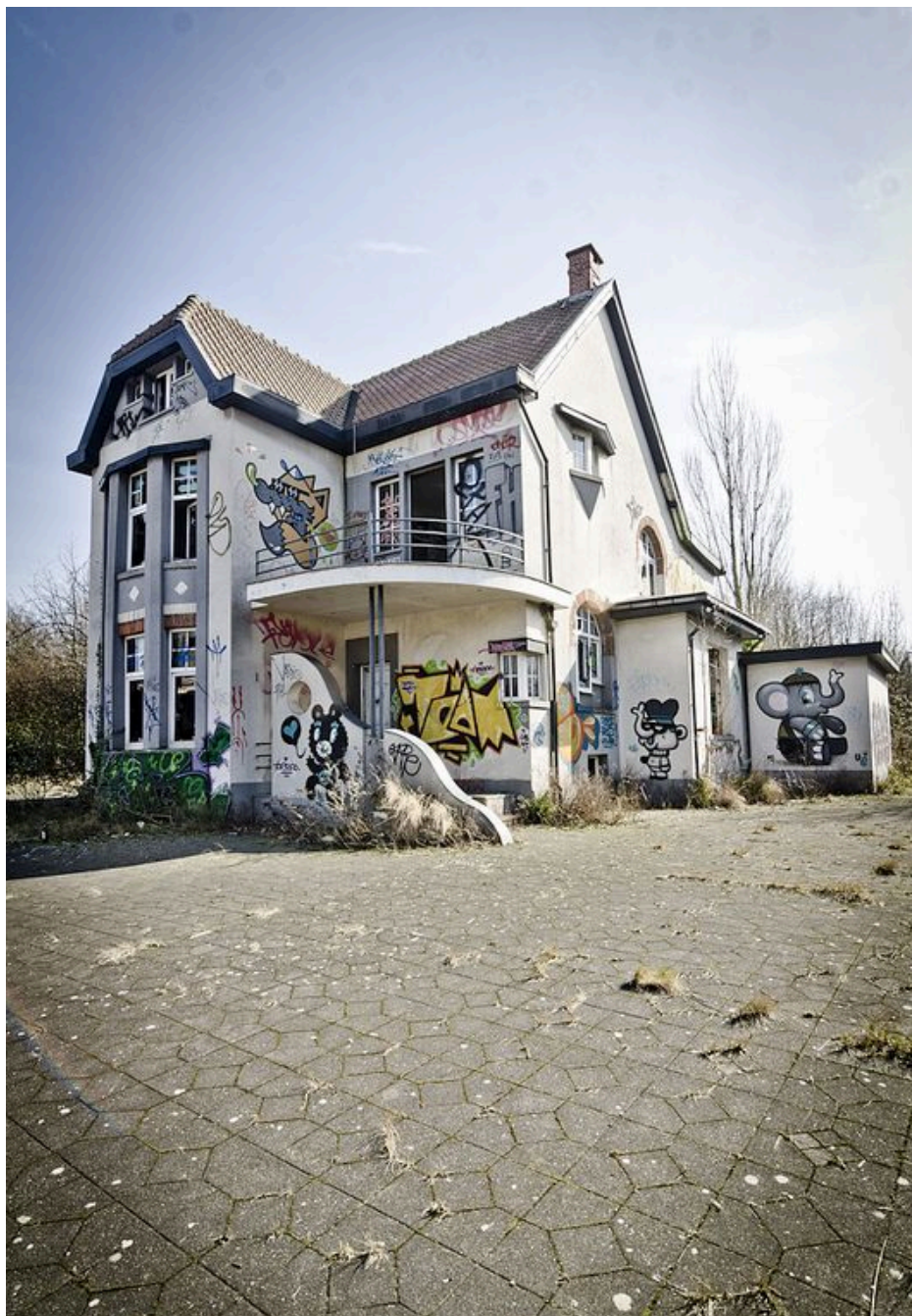
Fig. 34 : photo d'une maison abandonnée à Doel.