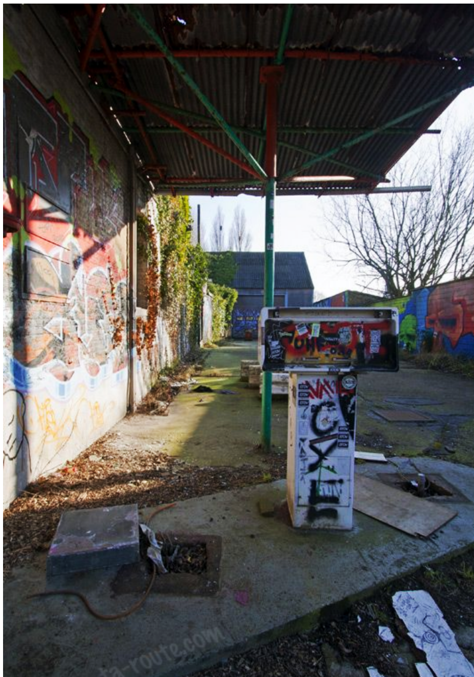
Fig. 40 : photo d'une ancienne station essence à Doel.