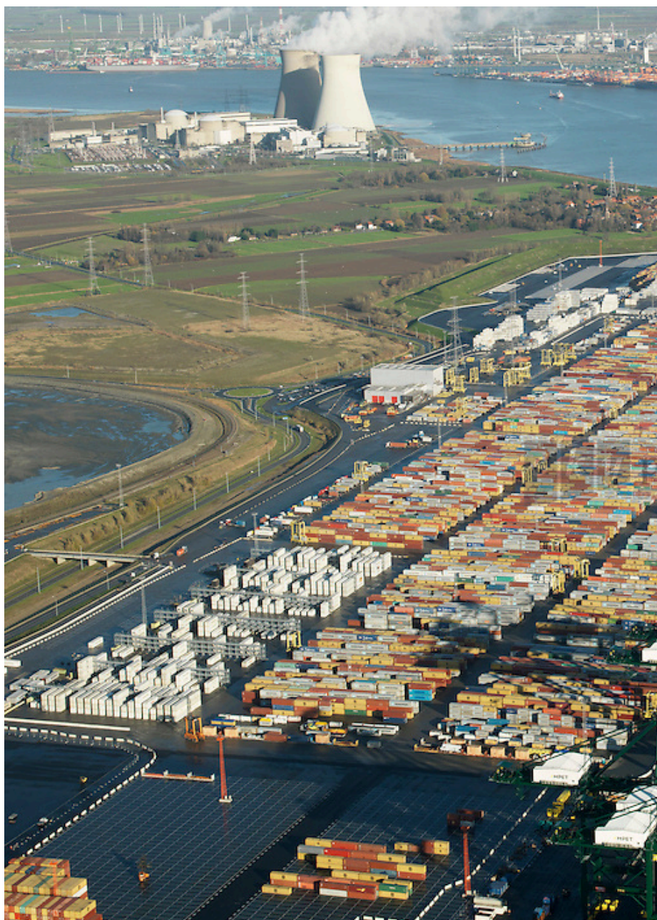
Fig. 2 : Vue aérienne du Deurganckdok.