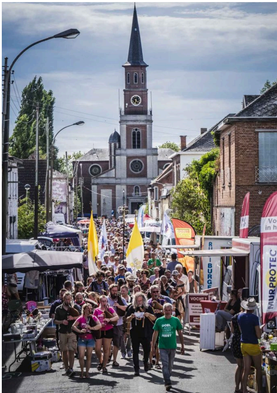
Fig. 26 : photo de la fête de Doel.