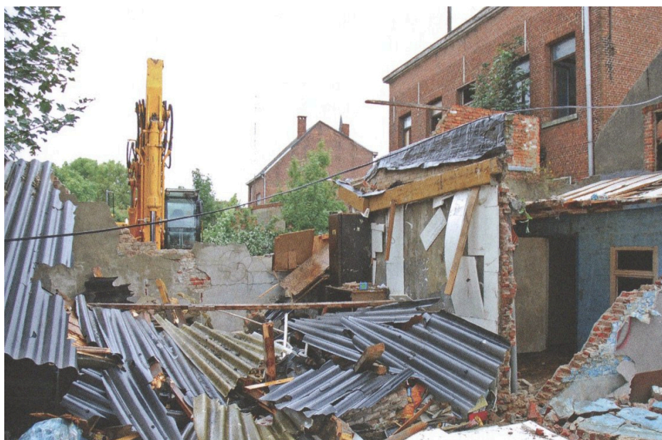
Fig. 13 : Démolition dans le centre de Doel.