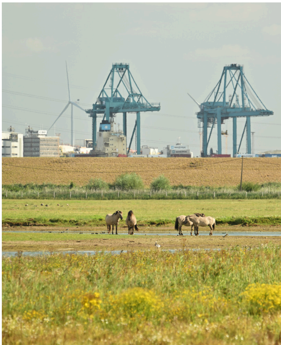
Fig. 21 : photo aux alentours de Doel.