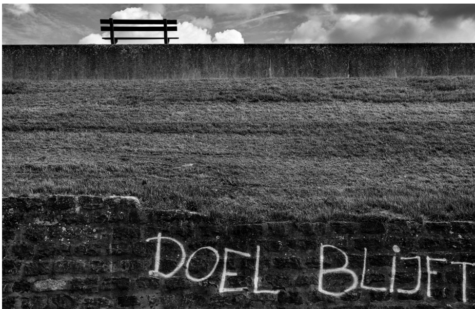
Fig. 15 : Photo d'une digue à Doel avec l'inscription « Doel blijft ».