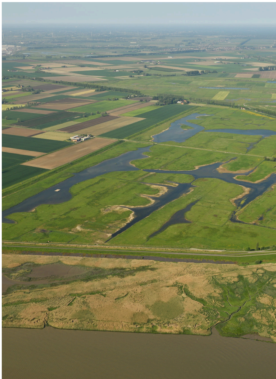
Fig. 22 : vue aérienne de Doelpolder Nord.