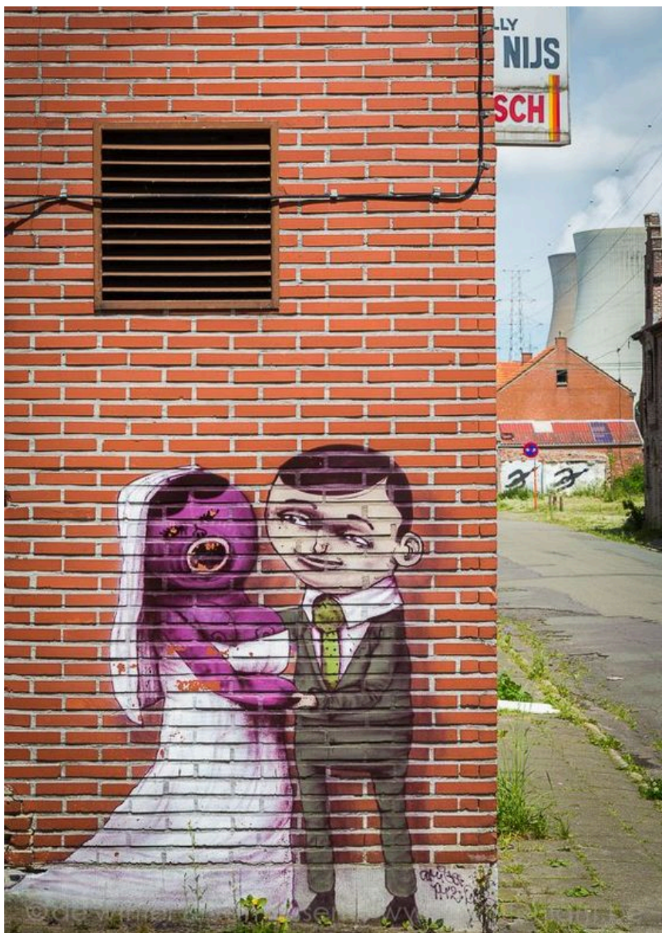
Fig. 42 : photo d'une façade à Doel.