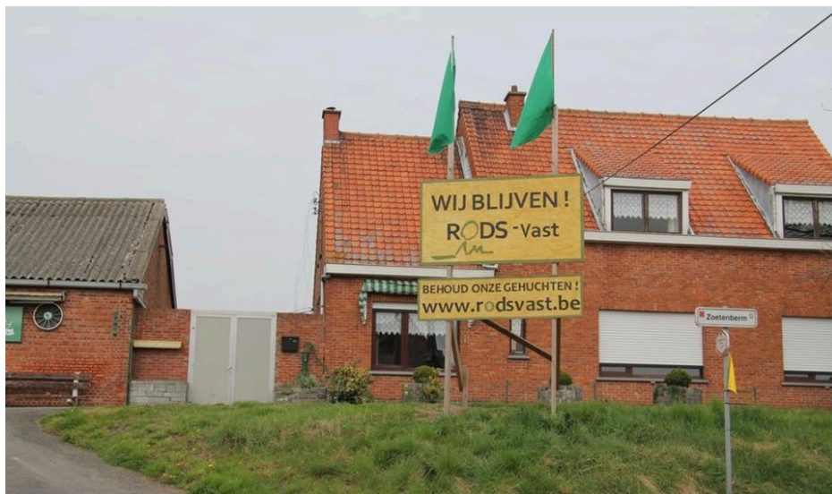
Fig. 8 : photo d'une pancarte de protestation pour les hameaux d'Ouden Doel et de Rapenburg.