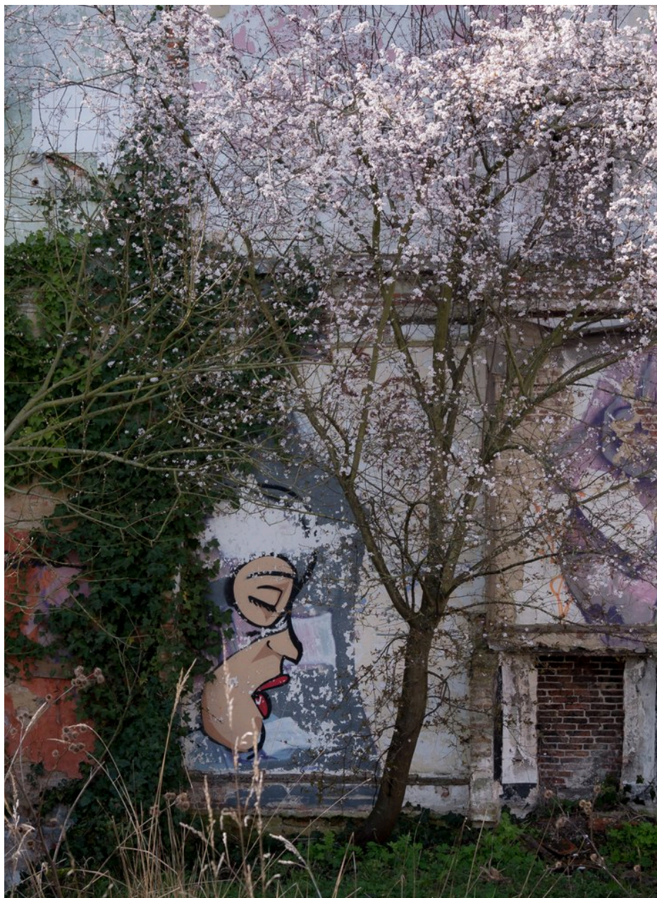
Fig. 31 : photo d'une façade à Doel.