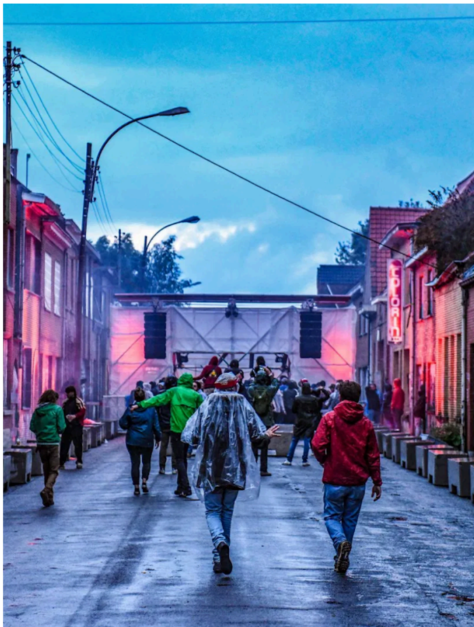
Fig. 46 : photo du Doel festival dans le centre de Doel.