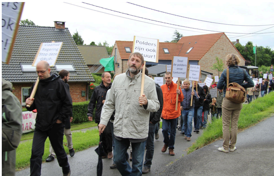
Fig. 5 : photo d'une manifestation à Beveren.