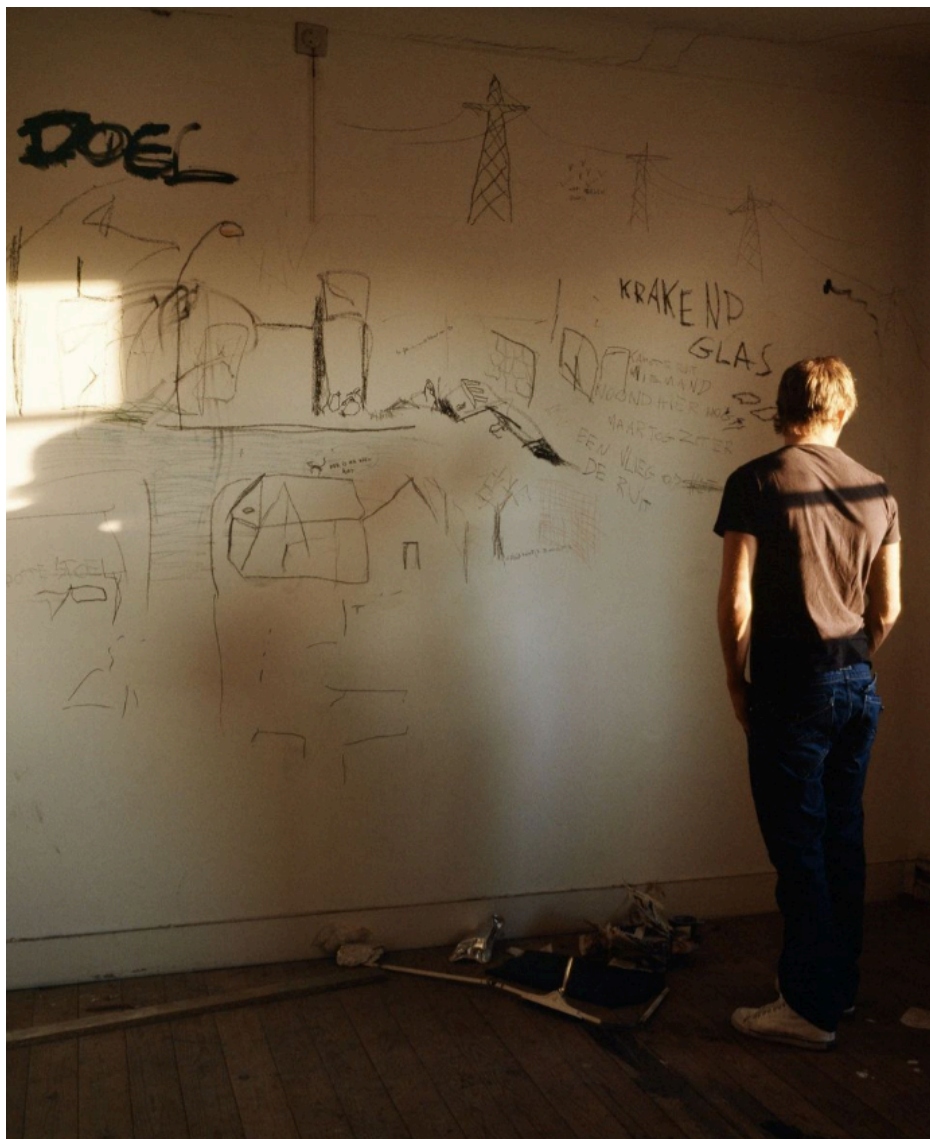
Fig. 37 : photo de l'intérieur d'une maison abandonnée à Doel.