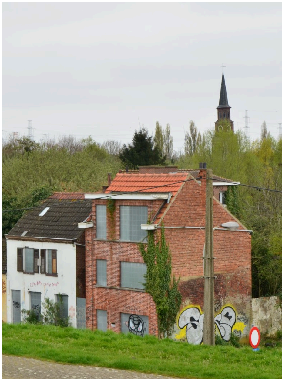
Fig. 30 : photo de maisons à Doel après la mise en place des plaques de fer.