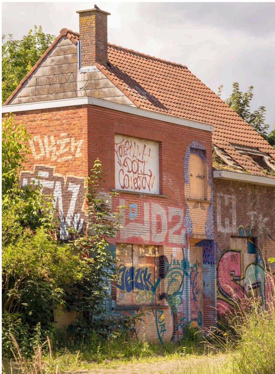
Fig. 32 : photo de maisons en ruines à Doel.