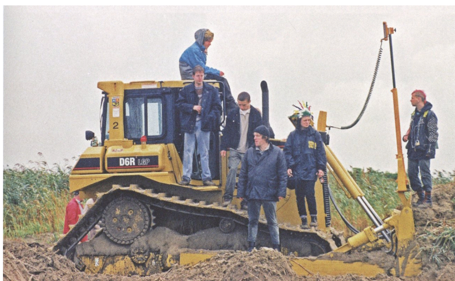
Fig. 4 : Occupation du chantier du Deurganckdok par des militants.