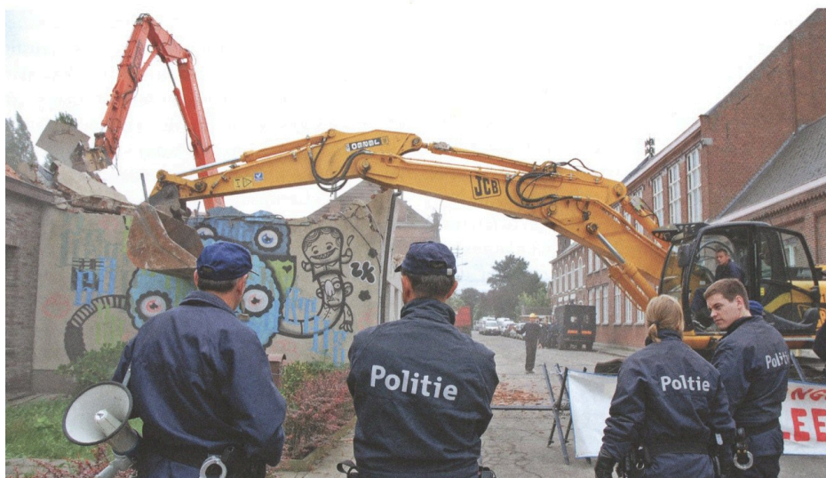
Fig. 12 : Démolition dans le centre de Doel.