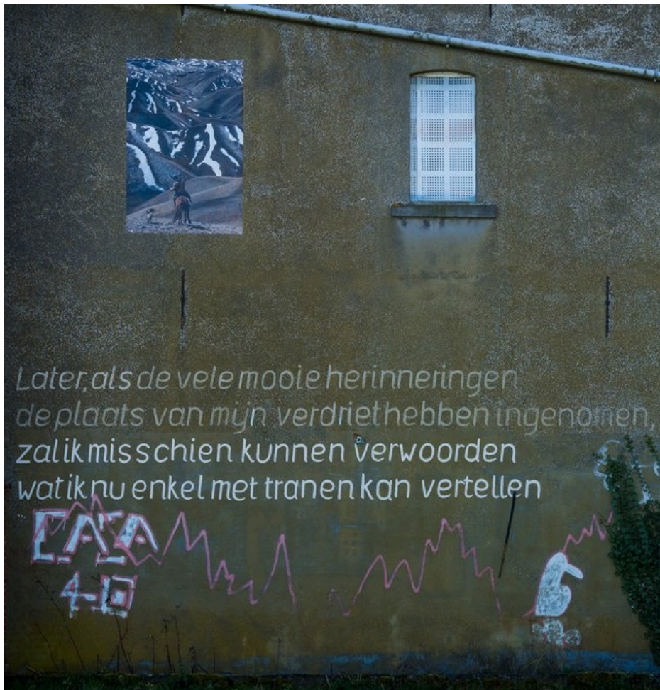
Fig. 24 : photo d'une citation de Dirk de Boeck sur une des façades de Doel. Traduction libre : « Plus tard, quand de beaux souvenirs auront pris la place de mon chagrin, je serai peut-être capable de formuler ce que je peux maintenant seulement raconter avec des pleurs ».