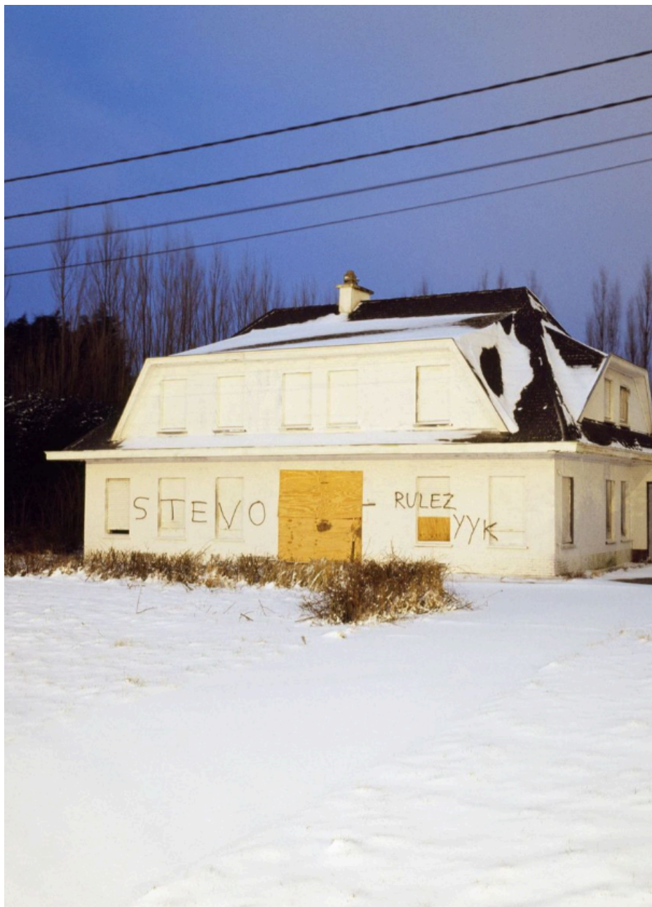
Fig. 23 : photo d'une maison abandonnée à Doel.