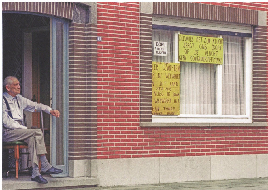
Fig. 7 : photo d'un habitant de Doel devant sa maison en 1999.