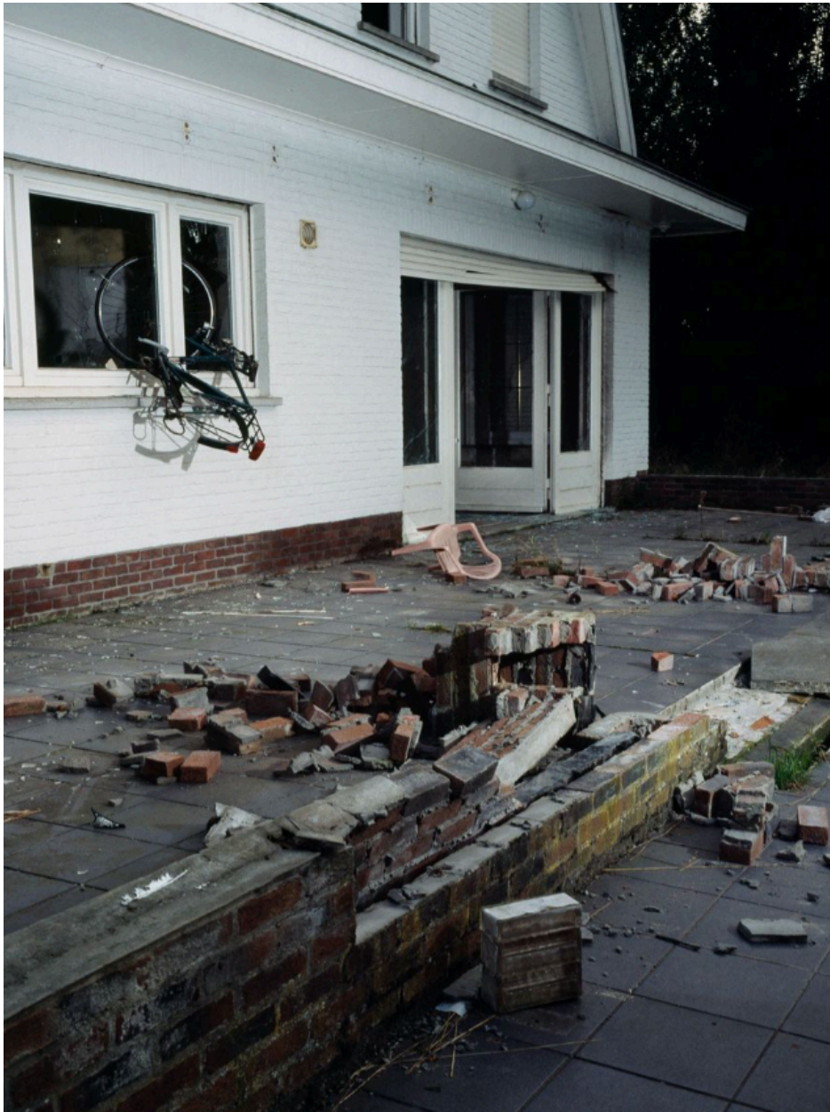
Fig. 39 : photo d'une maison abandonnée à Doel.