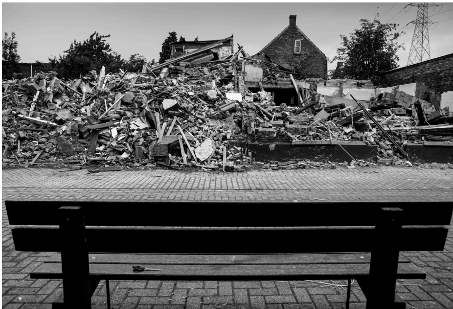
Fig. 14 : Photo d'une démolition à Doel.