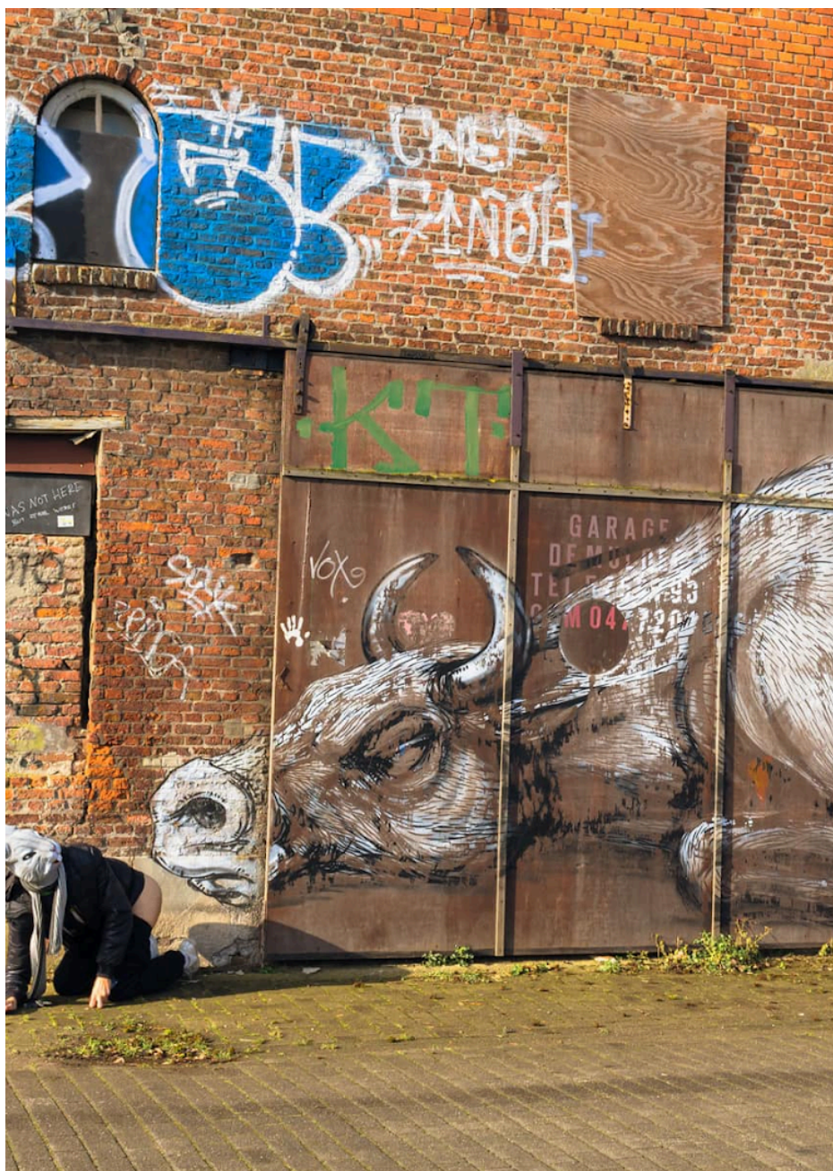
Fig. 41 : photo d'une façade à Doel.