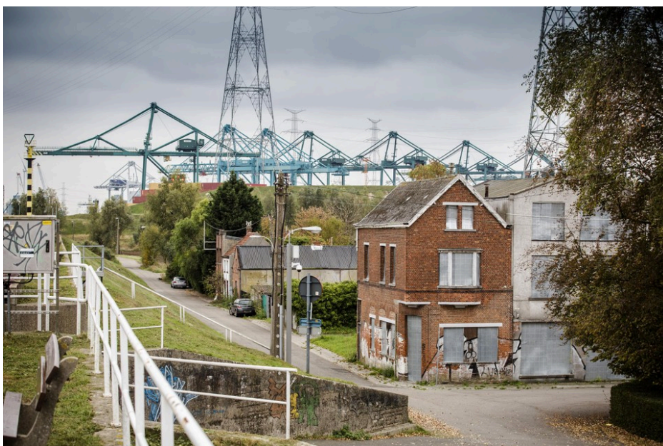
Fig. 28 : photo d'une ruelle de Doel.