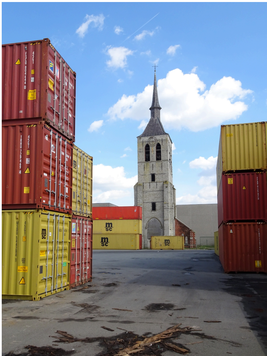
Fig. 16 : Tour Saint-Laurent de Wilmarsdonk près du quai Churchill.