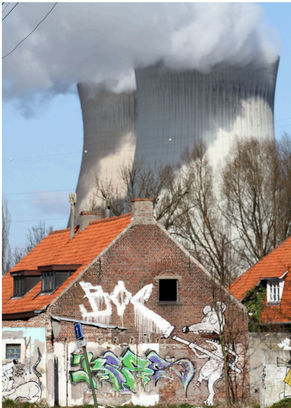
Fig. 36 : photo d'une maison abandonnée à Doel.