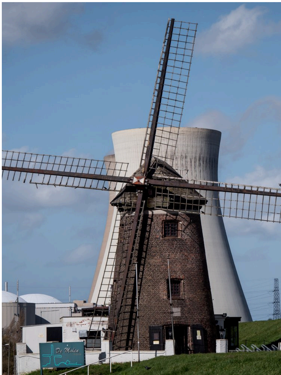
Fig. 19 : photo de la centrale nucléaire et du moulin de Doel.