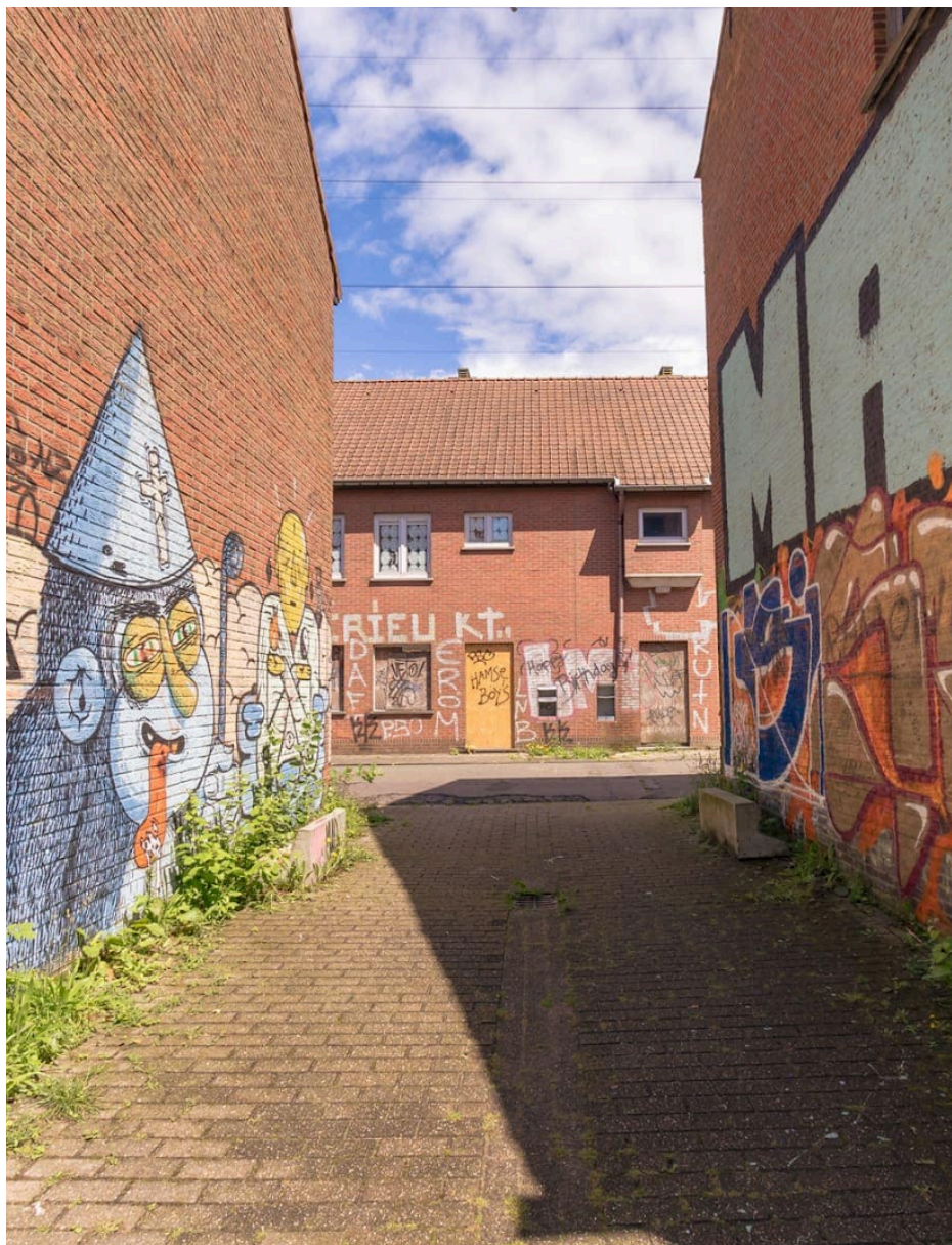
Fig. 33 : photo d'une ruelle à Doel.