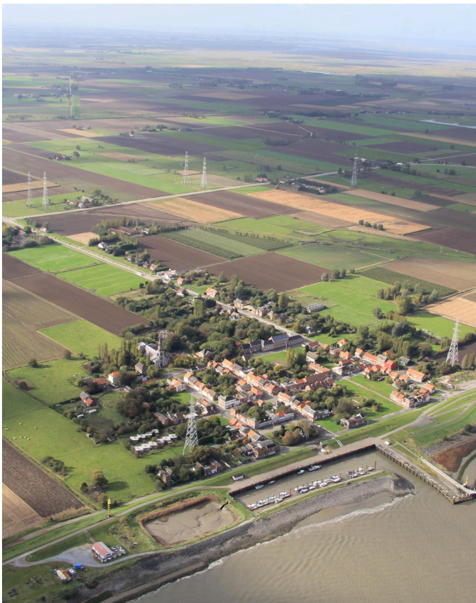
Fig. 18 : Vue aérienne de Doel.