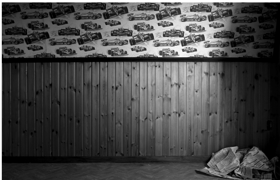
Fig. 10 : Photo d'une maison à Doel.