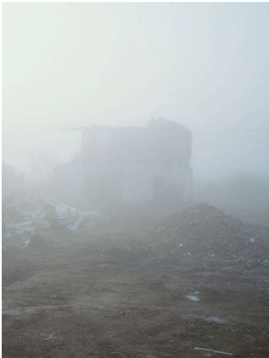
Fig. 35 : photo de démolition à Doel.