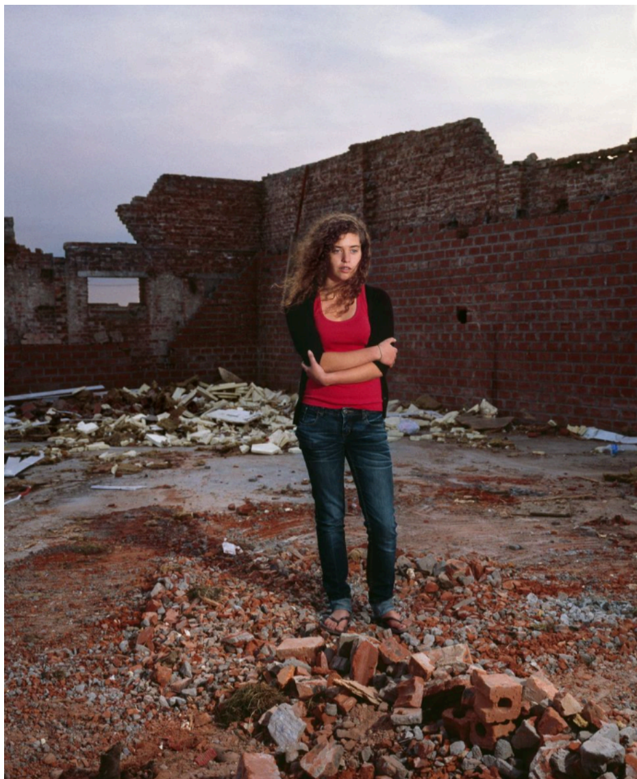
Fig. 38 : photo de ruines à Doel.