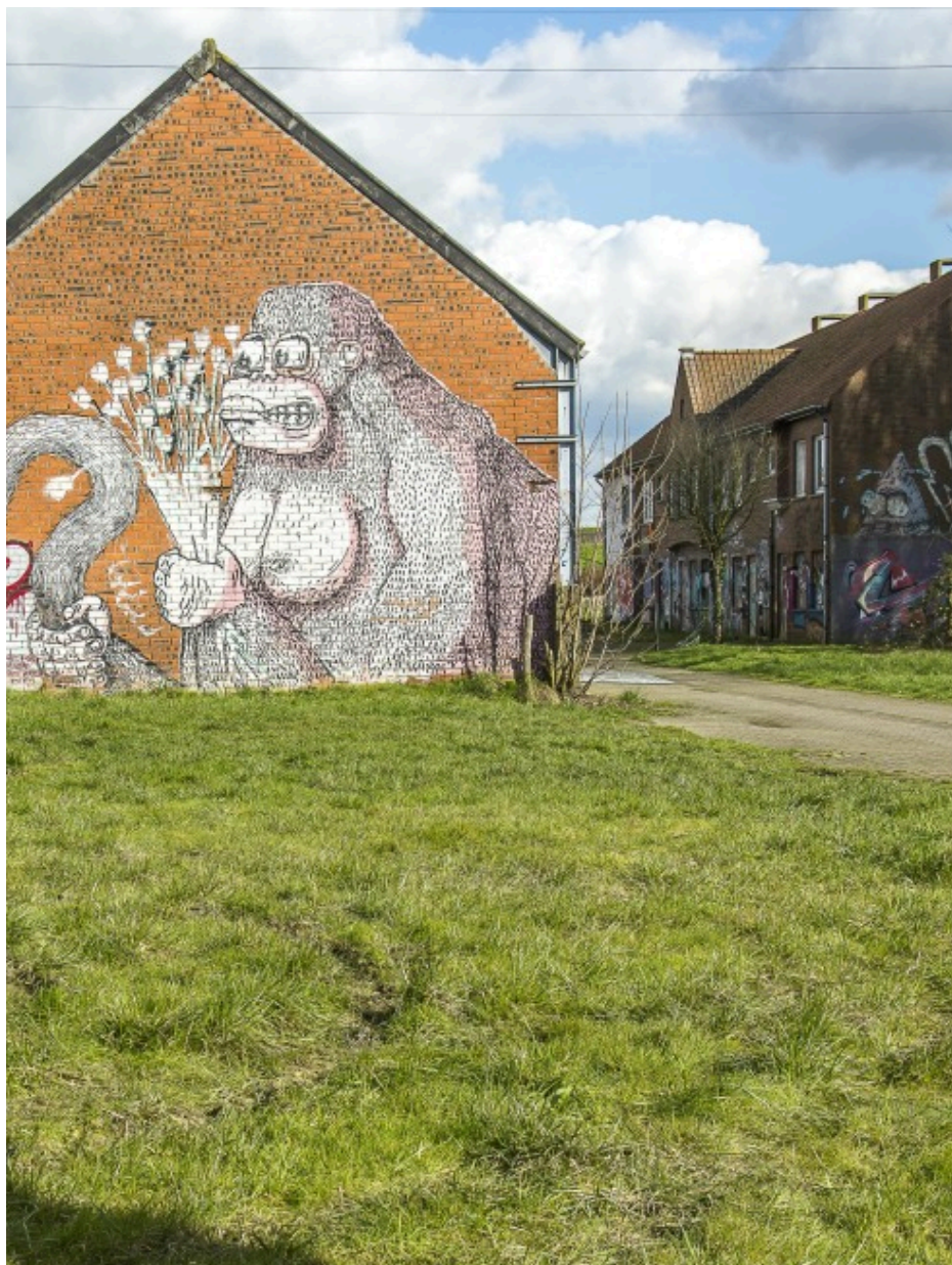
Fig. 43 : photo d'une façade à Doel.