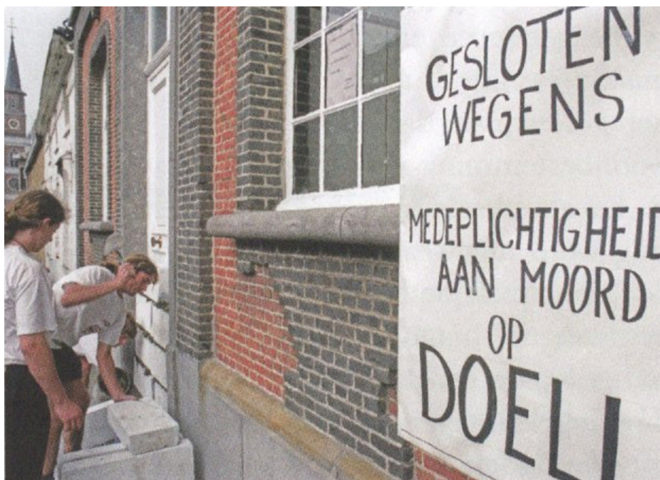
Fig. 3 : Des militants murent le bureau du médiateur social Roeland Alelbers.