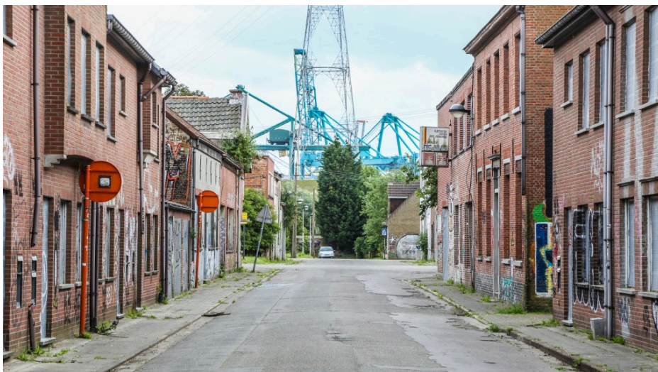
Fig. 27 : photo d'une ruelle de Doel.