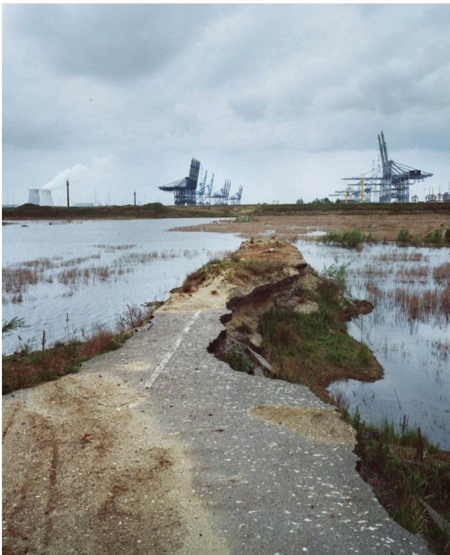
Fig. 20 : photo aux alentours de Doel.