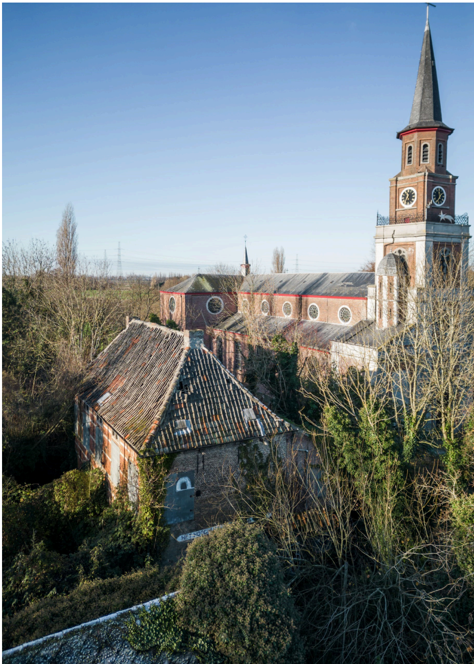
Fig. 11 : photo de la Hooghuis à Doel. Source : Herita. (2023, 30 avril). « Herita geeft Hooghuis in Doel een nieuw leven ». Architectura.

https://www.architectura.be/nl/nieuws/herita-geeft-hooghuis-in-doel-een-nieuw-leven/