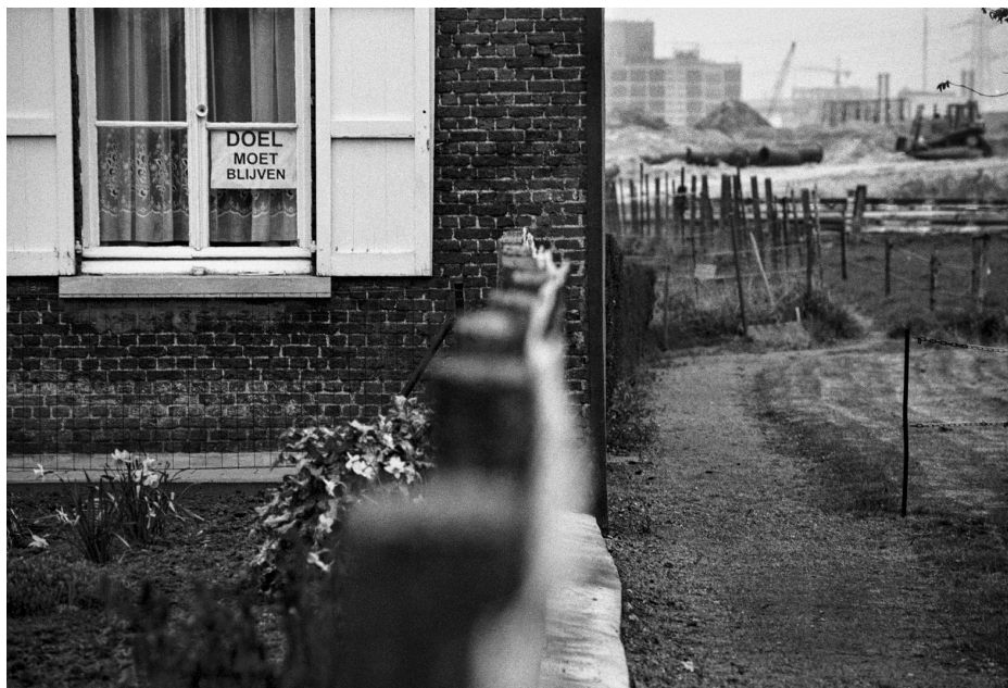
Fig. 9 : Photo d'une maison à Doel.