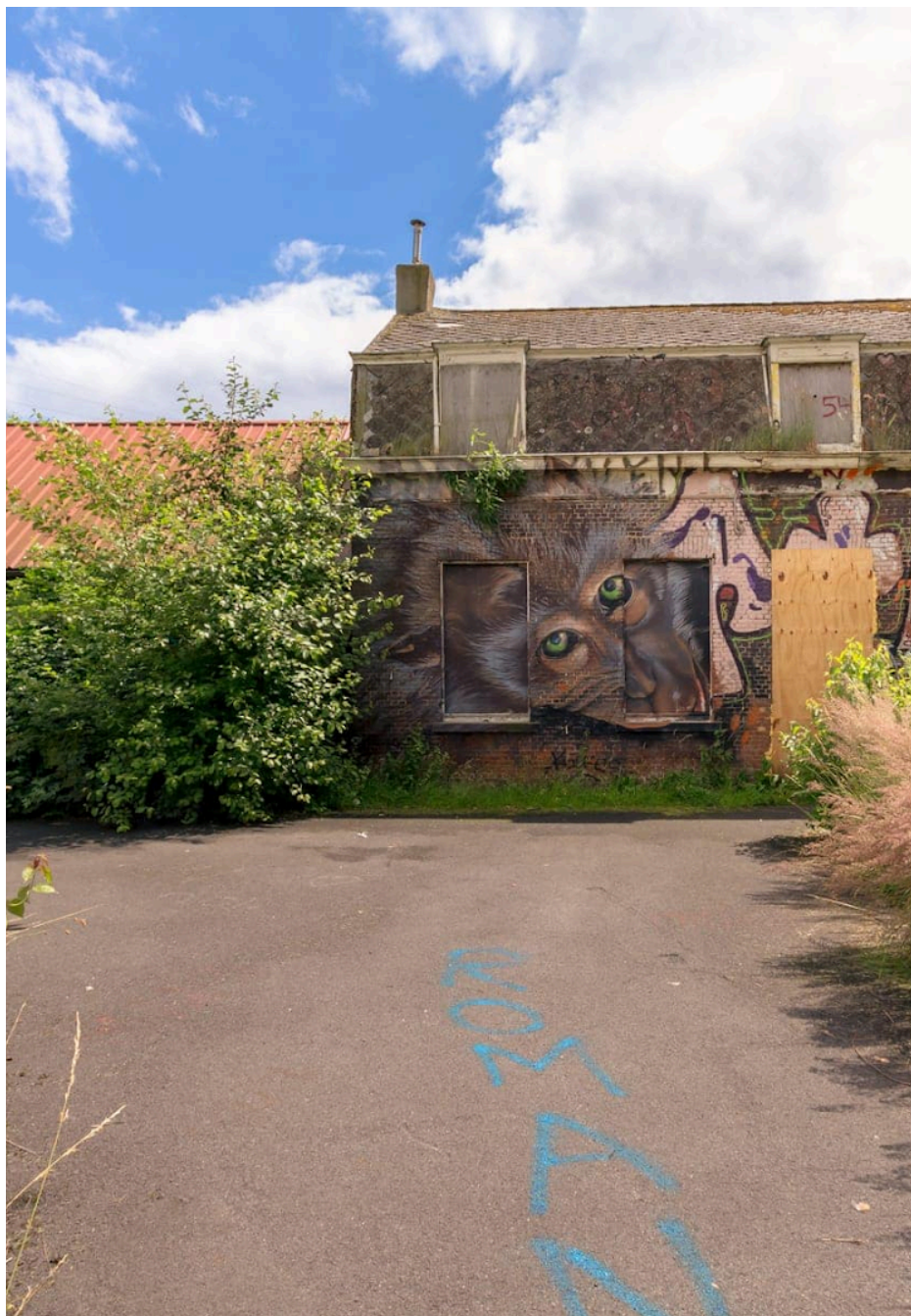
Fig. 45 : photo d'une façade à Doel.