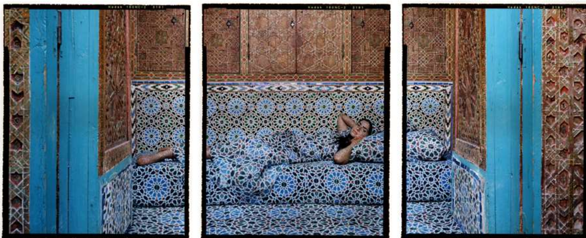
Figure 6. ESSAYDI, Lalla, Harem #18 , triptyque, chromogène monté sur aluminium, 152.5 x 366 cm, 2009, collection privée, Genève, disponible sur http://lallaessaydi.com/8.html , téléchargée le 15 août 2024. © Lalla Essaydi