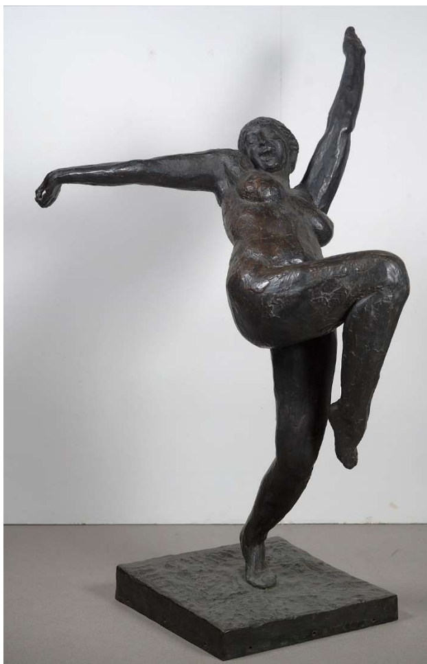
Figure 8. WOUTERS, Rik, La vierge folle , bronze, 197 x 89 x 135 cm, 1912, Bruxelles, Musée d'Ixelles, inv. CC 1251, disponible sur https://collections.heritage.brussels/fr/objects/37998 , téléchargée le 15 août 2024.