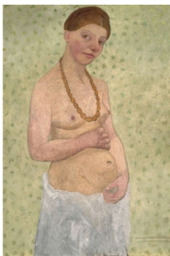
Figure 7. MODERSOHN-BECKER, Paula, Autoportrait au sixième anniversaire de mariage , huile sur carton, 101.8 x 70.2 cm, 1906, Brême, Paula Modersohn-Becker Museum, disponible sur https://www.artsy.net/artwork/paula-modersohn-becker-autoportrait-au-sixieme-anniversaire-de-mariage , téléchargée le 15 août 2024. © Paula-Modersohn-Becker-Stiftung, Brême.