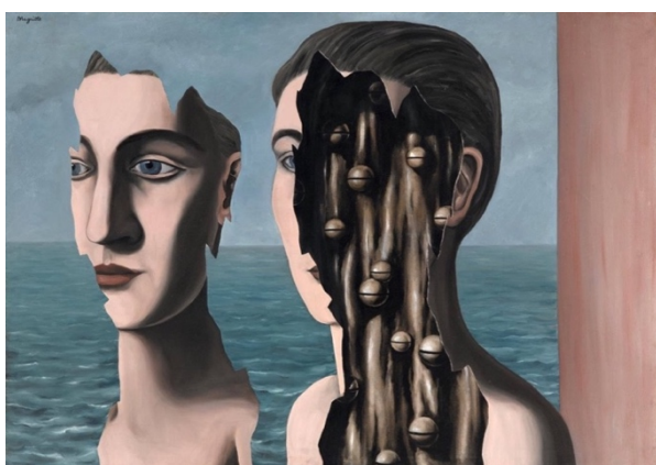
[René Magritte, Le double secret , 1927]

Deux exemples de la circulation de ce motif, en art moderne et contemporain :