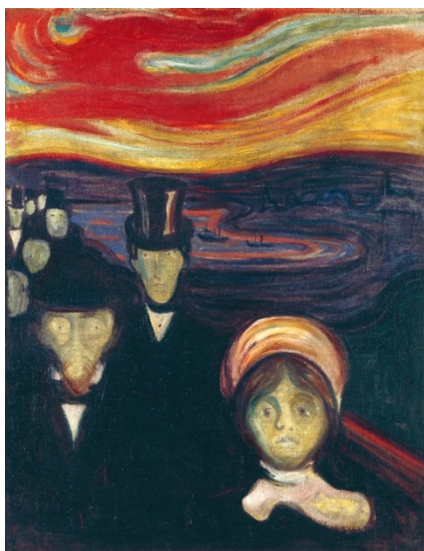
[Edvard Munch, L'Angoisse , 1894]

Absence et étrangeté de la voix, chez Munch et Picabia :