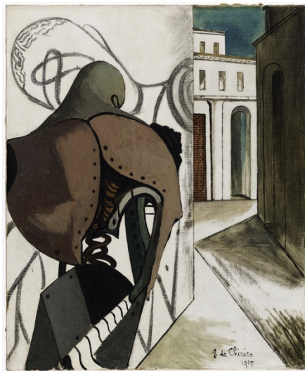
[Giorgio De Chirico, Les contrariétés du penseur , 1915]

À titre illustratif : l'on peut également reconnaître les traces ambiguës d'une impression des pensées sur la réalité chez Chirico, et un jeu de transgression du monde de la représentation vers le monde réel dans certaines œuvres de Magritte.