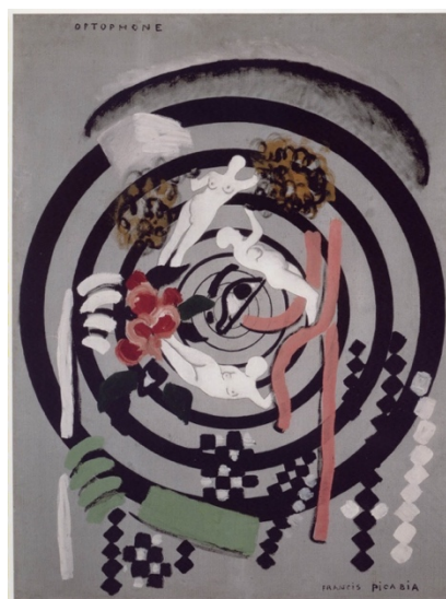
[Francis Picabia, Optophone II , 1921-1922]