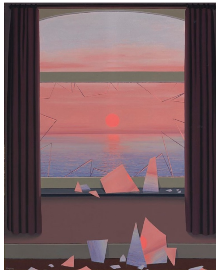
[René Magritte, Le monde des images , 1950.]